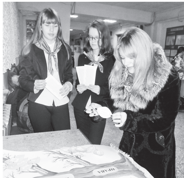
▲ Активисты ДОО «Ребятня республика» средней школы №3 провели акцию «Знай свои права»