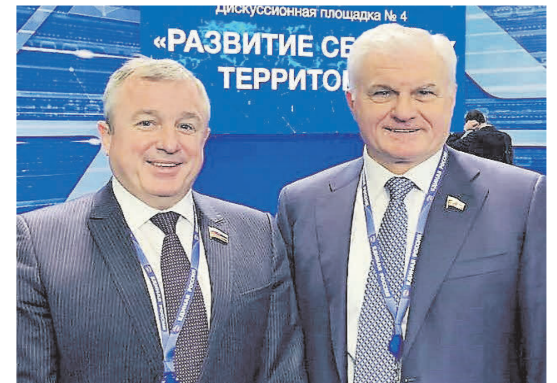
▲ Игорь Тюрин с Владимиром Плотниковым - первым заместителем председателя комитета Госдумы ФС РФ по аграрным вопросам