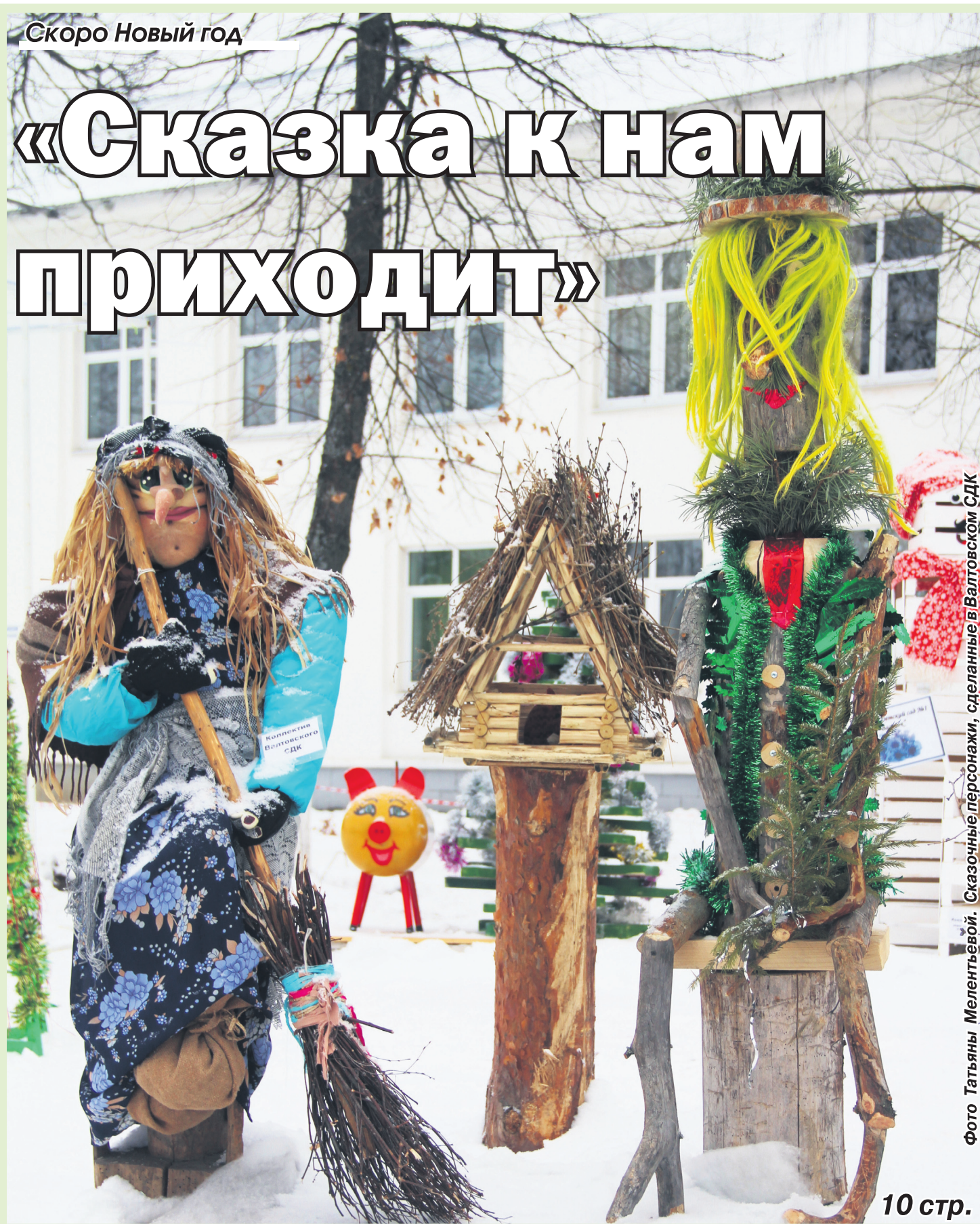
Сказочные персонажи, сделанные в Валтовском СДК