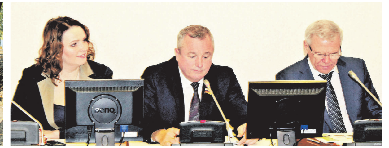
▲ В рабочем процессе