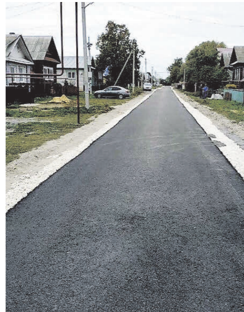
▲ Заасфальтирована центральная улица в с. Б-Окулово