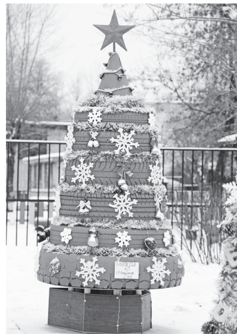
▲ Зеленую красавицу из шин сделали обучающиеся 2 класса школы №3