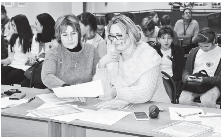
▲ Компетентное жюри достойно оценило работы конкурсантов