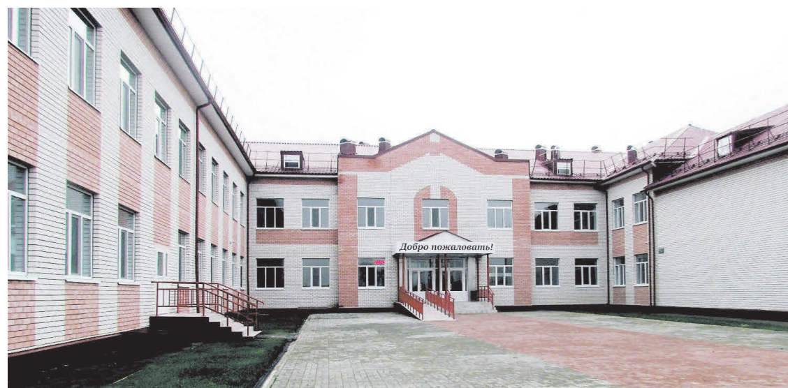
▲ В с. Натальино открыта новая школа на 150 учеников

Подводя итоги уходящего года, хочу доложить вам о том, что сделано конкретно для решений вопросов округа, что я думаю и что в планах.