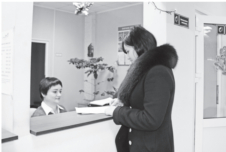
▲ В Навашинском МФЦ

На госпортале представлен широкий спектр государственных и муниципальных учреждений, оказывающих государственные и муниципальные услуги – Налоговая служба, Пенсионный фонд, органы ЗАГС, подразделения по вопросам миграции, учреждения здравоохранения, государственная инспекция безопасности дорожного движения и многие другие учреждения.