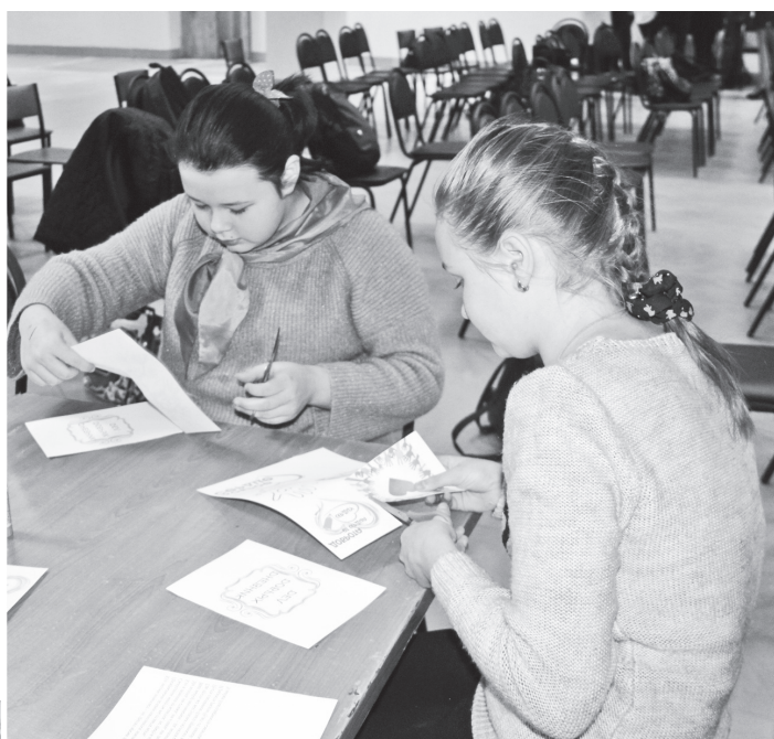
▲ Активисты с удовольствием изготавливали дневник добрых дел