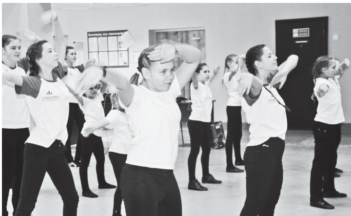
▲ Обучающиеся Дворца детского творчества подарили зажигательный танец