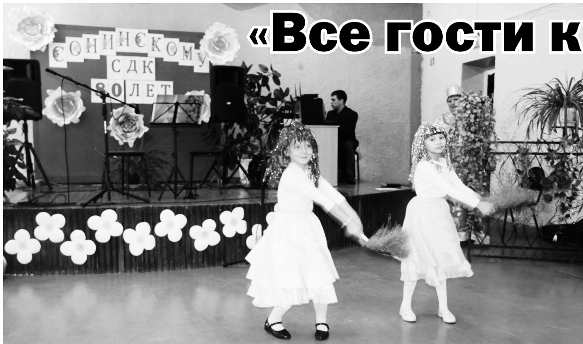
▲ На сцене выступает танцевальный коллектив «Барби»

В минувшее воскресенье сельский Дом культуры села Сонино отметил 80-летие. В назначенный час поздравить «именинника» пришли мест-