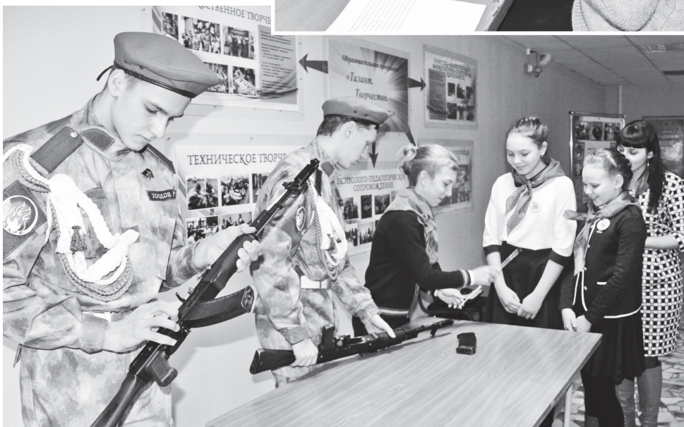
▲ Юноши военно-патриотического клуба «Пламя» провели мастер-класс по сборке и разборке автомата