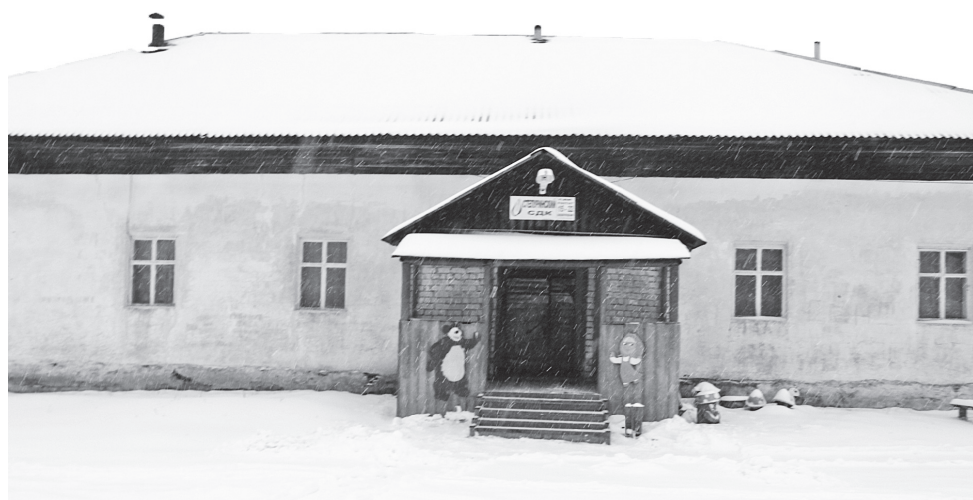
▲ Степуринский СДК