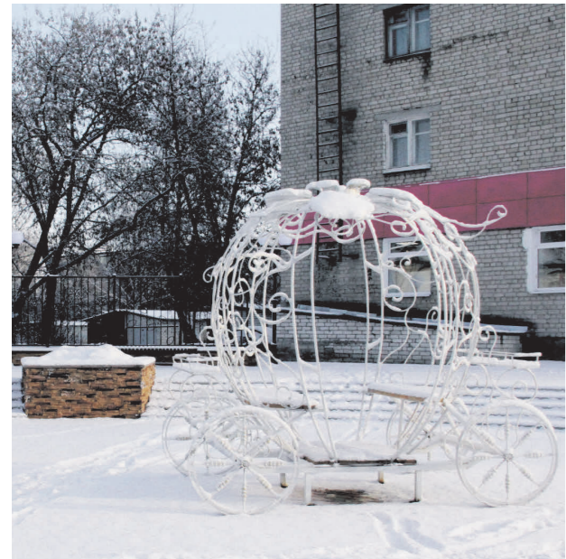
▲ Благоустройство площадки перед отделом ЗАГС

Мне, как депутату областного Законодательного Собрания, все это видно и понятно. Я прикладываю свои силы и возможности для того, чтобы работа власти в нашем городском округе была более осмысленной, направленной на улучшение благосостояния жителей и благоустройство территории.