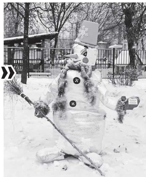
▲ Новогодний снеговик – результат коллективного труда Натальинского детского сада