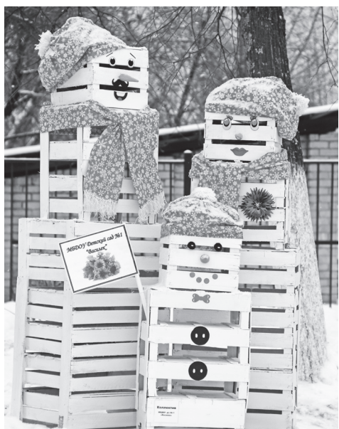
▲ Таких замечательных снеговиков из ящиков соорудили в детском саду №1 «Василек»