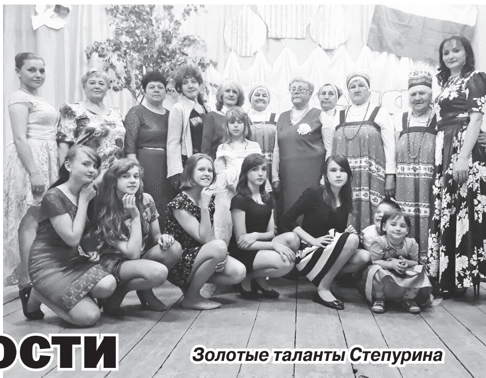
Золотые таланты Степурина