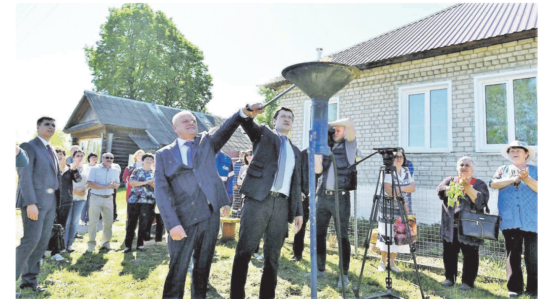
▲ Пуск газа в с. Монаково