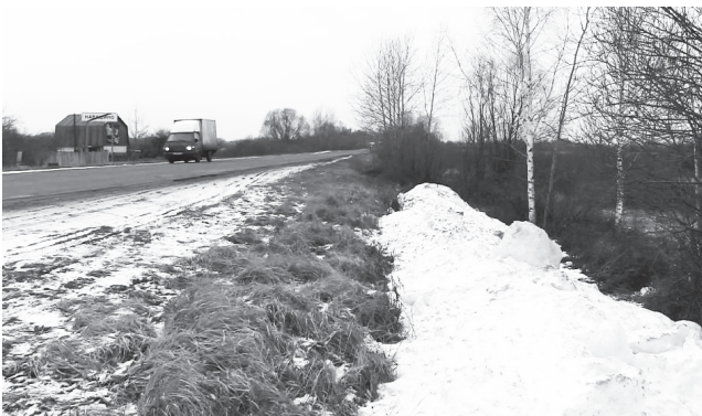
▲ Сугроб на обочине привлек внимание жителей

Правда, место это, как выяснилось, находится немного дальше, чем есть на самом деле. В районе бывшей дороги, ведущей к старому наплавному (понтонному)