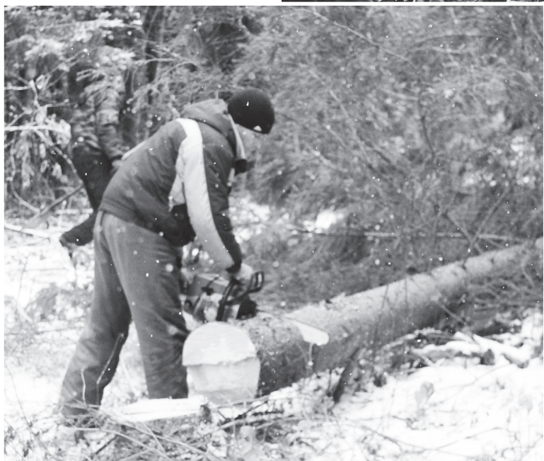
▲ Срубили нашу елочку под самый корешок

встречал нас с препятствиями, на пути попадались огромные бревна. Сопровождавшим нас рабочим приходилось бревна распиливать и убирать с дороги. Затем совершенно неожиданно на капот впереди идущей погрузочной машины упала небольшая ель. От неожиданности стало страшно. С этим испытанием мы также справились. Спустя еще один час, нам все-таки удалось добраться до места: уже пешком по сугробам и сквозь лесную чащу. В лесу мы стали замерзать, но, несмотря на это, мы не переставали восхищаться его красотой и величием. Огромные густые ели были покрыты пушистыми