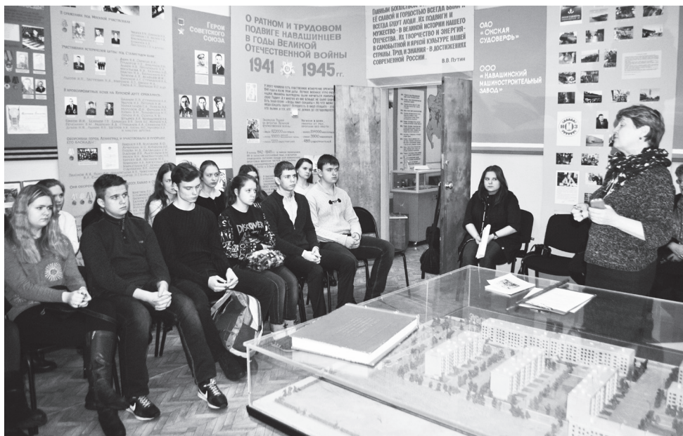
▲ Урок истории «По ком звонит колокол» в музее

В русском языке слово «холокост» при обозначении понятия, которое не является именем собственным, пишется со строчной буквы, а по отношению к геноциду евреев – с заглавной. Под термином «холокост» (со строчной буквы) понимается также любой акт геноцида.