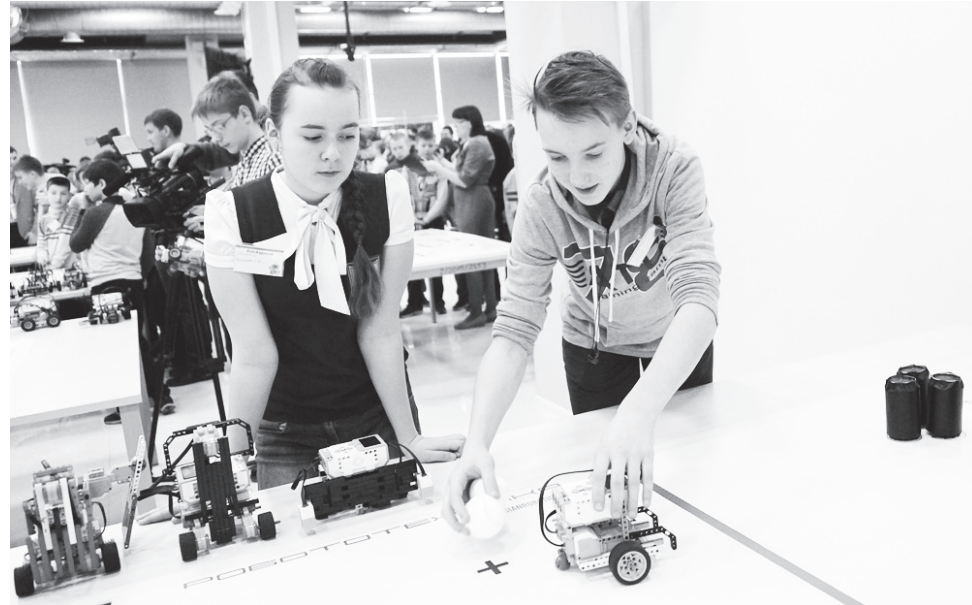
▲ «РобоФест» – настоящая «кузница кадров» для технических вузов области

Талантливые ребята со всех концов Нижегородской области, а также из Москвы и Санкт-Петербурга приняли участие в ежегодном фестивале «РобоФест-НН», представив свои изобретения – роботов, беспилотные летательные аппараты, бортовые системы. С 2013 года число участников фестиваля увеличилось вдвое. Вырос и технический уровень: идеи юных изобретателей охотно «берут на карандаш» промышленники, а «Группа ГАЗ» уже трудоустроила на своих предприятиях семь десятков участников предыдущих «РобоФестов»! Представители технических вузов Нижнего заявляют о готовности зачислить в ряды своих студентов победителей фестиваля, которым в марте предстоит защищать честь нашей области в Москве.