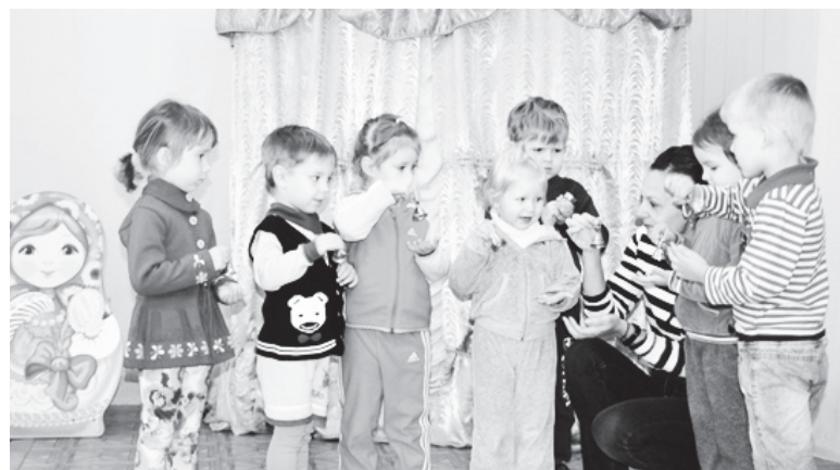
▲ Динь-дон, динь-дон – звенели колокольчики в руках детей на пути в мир музыки