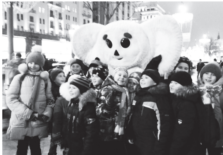
▲ Яркие впечатления на лицах, в сердцах – радость, а сознание сохранит память на годы, взяв ситуацию на заметку как пример для подражания в будущем

Татьяна МЕЛЕНТЬЕВА