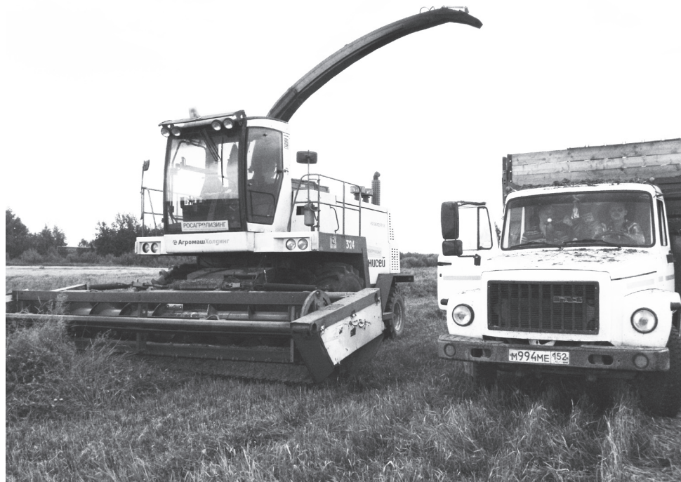
▲ Заготовка силоса из многолетних трав

Основными направлениями в развитии агропромышленного комплекса Нижегородской области является производство зерна и кормов для животноводства. Учитывая это, возникает необходимость в увеличении посевных площадей. Немаловажную роль здесь играет решение вопроса вовлечения в оборот неиспользуемых земель сельскохозяйственного назначения. Министерством сельского хозяйства и продовольственных ресурсов Нижегородской области проведена работа с муниципальными районами и городскими округами Нижегородской области по вопросам вовлечения в оборот неиспользуемых земель сельскохозяйственного назначения. Определен ряд мер, направленных на оптимизацию работ в данной сфере. Принятые меры позволили в прошлом году вовлечь в сельскохозяйственный оборот более 30 тыс. гектаров ранее неиспользуемых земель сельскохозяйственного назначения. Стоит задача по вовлечению в оборот 200 тыс. гектаров пашни, которую еще можно вовлечь в производственный оборот без значительных затрат, поэтому в текущем году работа будет продолжена.