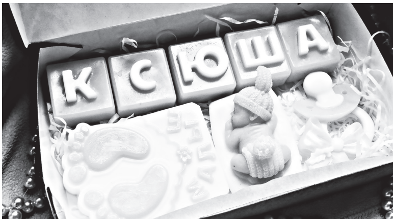
▲ Декоративное мыло может стать приятным подарком

Светлана ШЕМЕТОВА