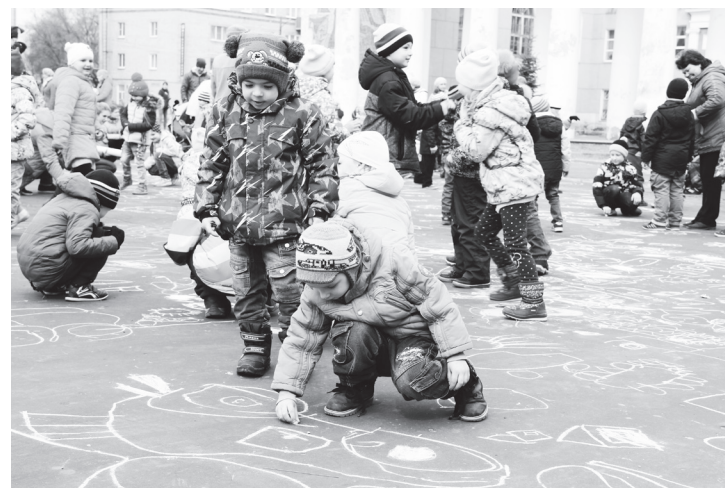
▲ Рисунок на асфальте — излюбленная забава малышей