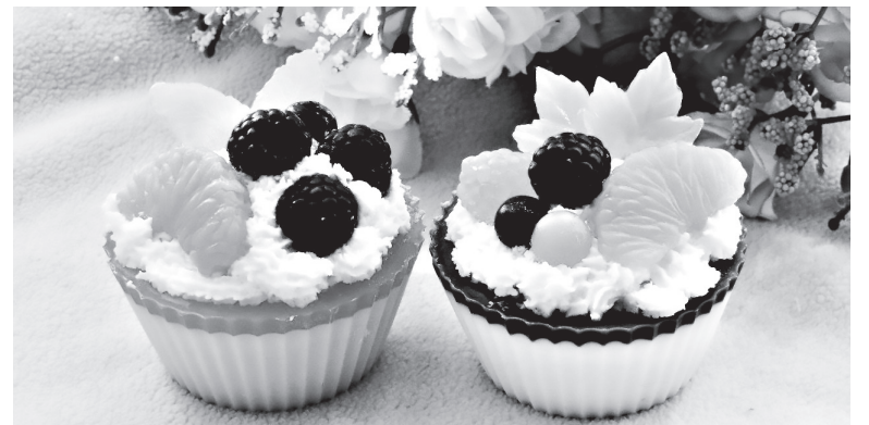
▲ Мыло может выглядеть аппетитно!