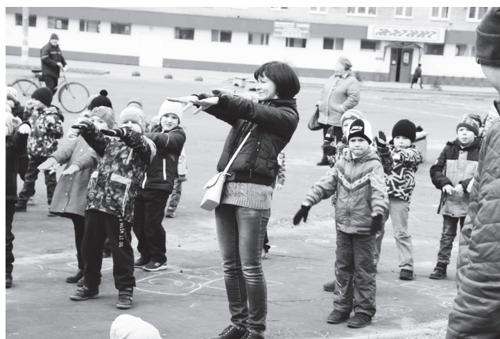
▲ Делать зарядку необходимо, а всем вместе еще и весело!