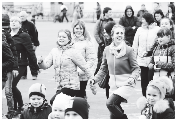
▲ Студенты техникума — молоды, бодр, задорны!