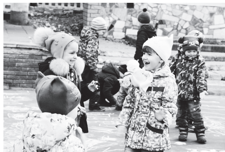
▲ Позитивные эмоции — на лицах детей