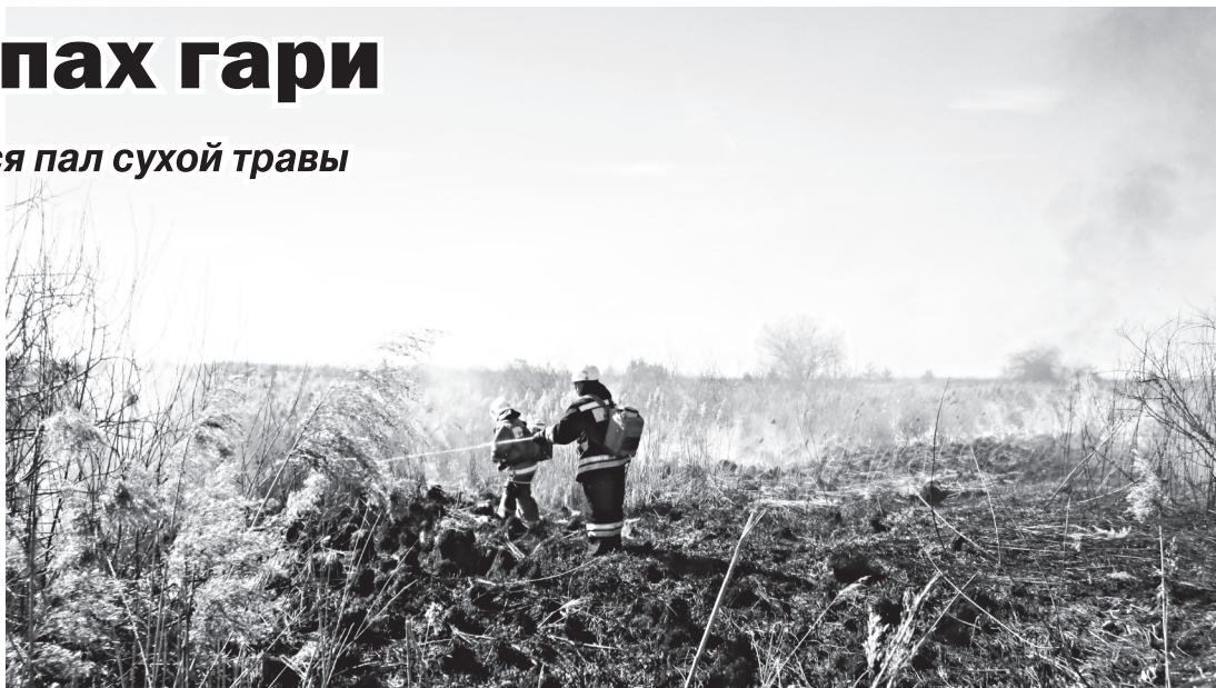
▲ Помните! Каждый акт поджога – это преступление против хрупкого мира природы

– Если брать самый простой случай пала сухой травы, то за него согласно ч. 1 ст. 20.4 КоАП РФ может быть вынесено обычное предупреждение или наложен штраф, размер которого составляет от 1000 до 1500 рублей – для физического лица, от 6000 до 15000 – для должностного лица, от 150000 до 200000 – для юридического лица, – рассказывает начальник Навашинского районного лесничества Алексей Марков. – Если подпалить траву в то время, когда был объявлен особый противопожарный режим, размер штрафа возрастает до следующих значений: для физических лиц от 2000 до 4000 рублей, для должностного лица 15000–30000 и для юридического от 400000 до 500000. Если