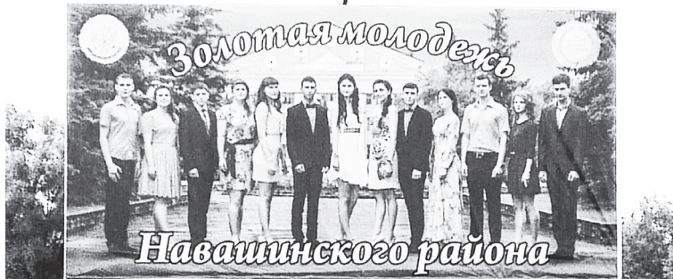
▲ Баннер, установленный на въезде в город