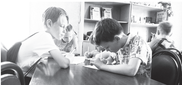
▲ Ребята из школьного лагеря принимают участие в конкурсе

Кстати, покидая библиотеку, я тоже решила поучаствовать в создании от руки написанной книги по произ-