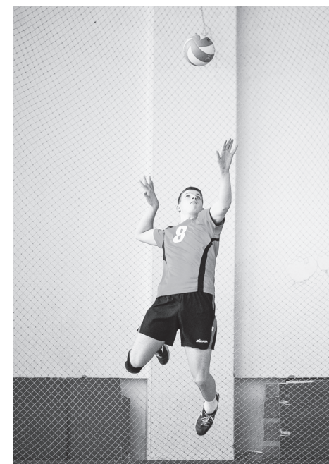
▲ Красивых и ярких моментов было много

Алена ТЕРКУНОВА.