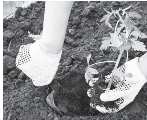
▲ А вот рассаду томатов в теплицу высаживают 10-15 мая