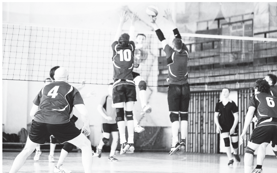
▲ 33 встречи, и все – напряженные