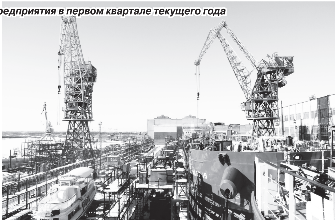
▲ Панорама судостроительного завода. Февраль 2017 года. Ведется работа по переоборудованию танкеров проекта RST27

Светлана ШЕМЕТОВА