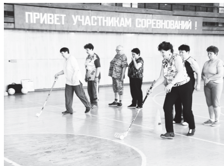
▲ В эстафете важно все: и ловкость, и скорость, и взаимовыручка

Группа пенсионеров округа приняла участие в спартакиаде пенсионеров России на двух уровнях: муниципальном и зональном. 16 навашинец пожилого возраста за активность, ловкость, скорость в конкурсах и эстафетах, проходивших в ФОЦ «Здоровье», получили от организаторов – управления культуры и спорта администрации округа, местного отделения «Союза пенсионеров России» – грамоты и сладкие призы. Следующим этапом соревнований стал зональный.