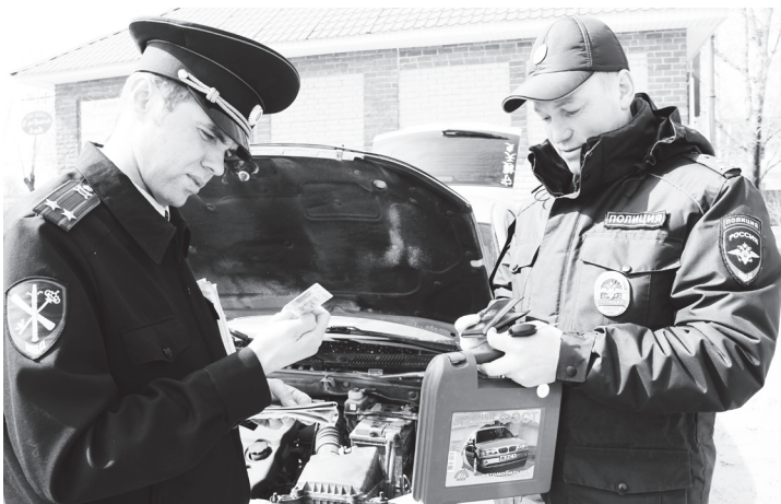
▲ Укрепляя дорожно-транспортную дисциплину

Ольга НОВИКОВА, специалист по связям с общественностью