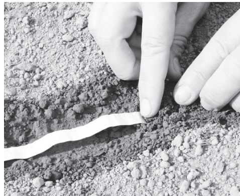
▲ Лучшие сроки посева моркови – первая-вторая декады мая