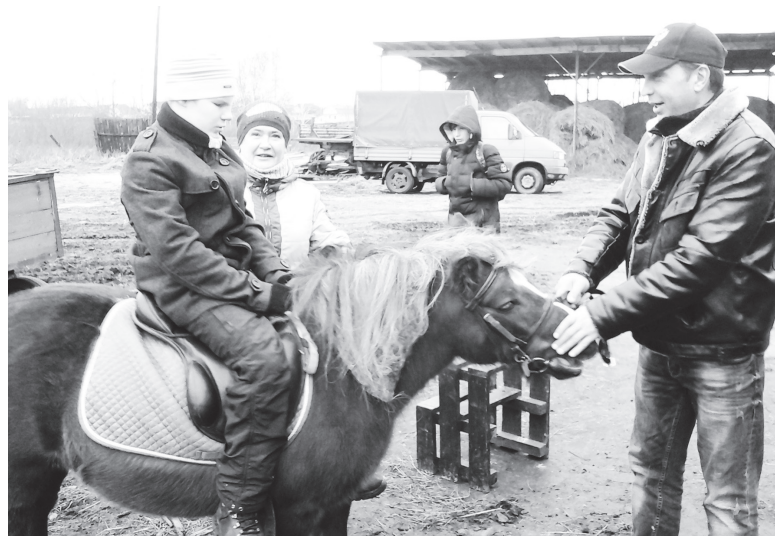
▲ Этот день запомнится надолго

31 октября дети-инвалиды и их родители побывали в конно-спортивном клубе «Берендеево» городского округа город Выкса. Приехавшие сюда впервые могли полюбоваться большим количеством лошадей разных пород, а также пони и осликом. Дети кормили, гладили животных. От общения с ними получали большое удовольствие.