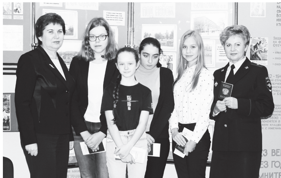
▲ Участники торжества