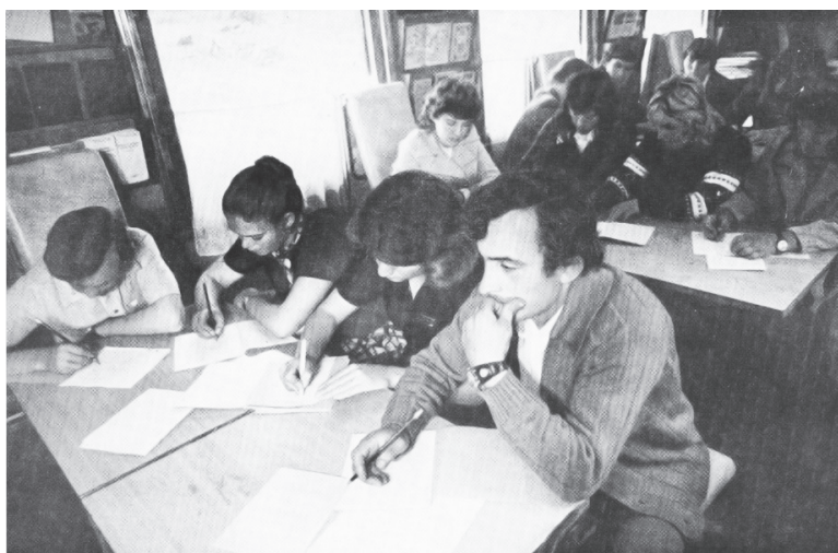
▲ В вагоне-лектории

В 80-е годы XX века советское руководство приняло грандиозную программу подъема сельского хозяйства Нечерноземья РСФСР. Для осуществления этой амбициозной программы требовалась мобилизация усилий населения всей страны. Руководство государства ориентировалось на ленинские слова, что «идея становится материальной силой лишь тогда, когда овладевает сознанием масс». Именно поэтому была важна организация эффективной агитационно-массовой пропагандистской работы среди населения страны. В этих целях ЦК ВЛКСМ организовал рейды агитпоездов.