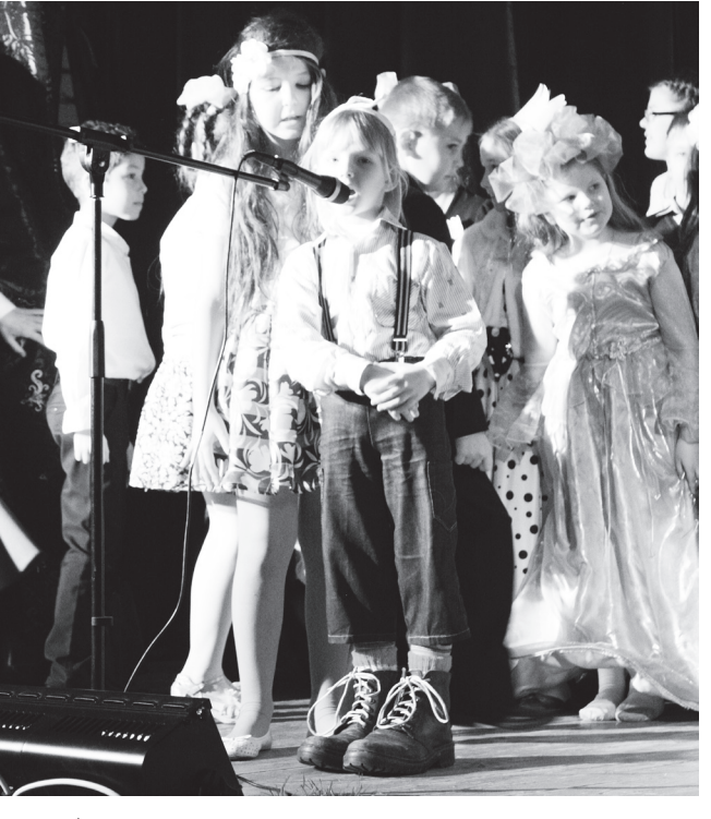
▲ Чудеса перевоплощения от юных артистов