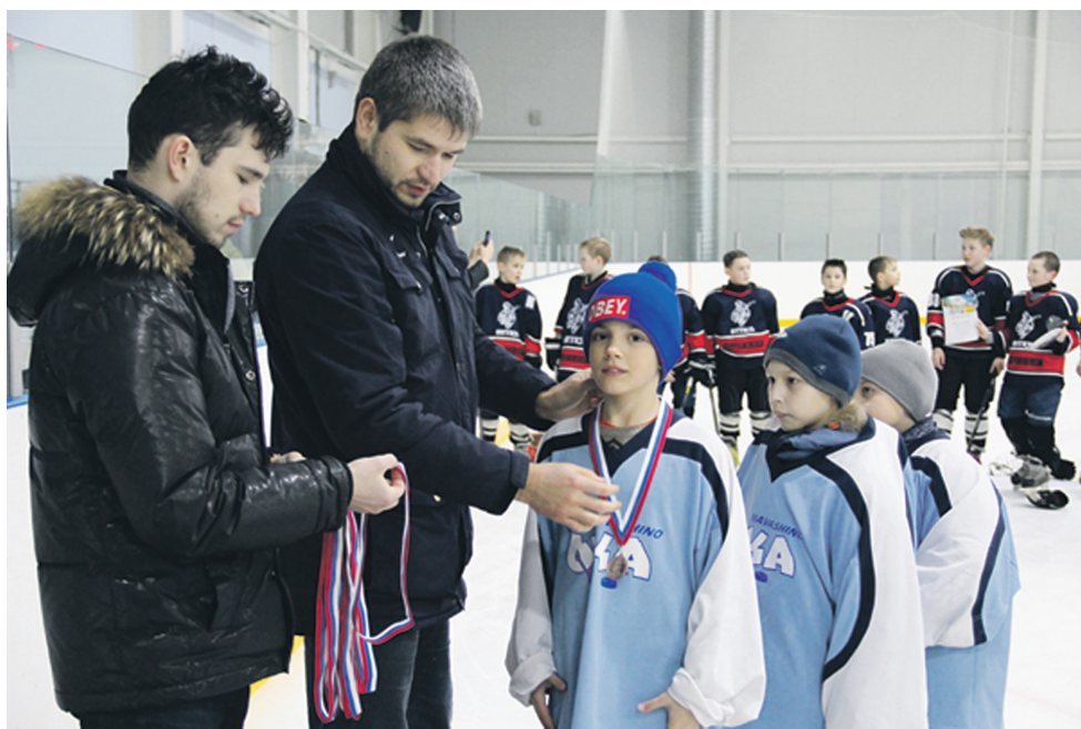
▲ Третье место - хороший результат для наших начинающих хоккеистов

Ответы на сканворд, опубликованный на стр. 10