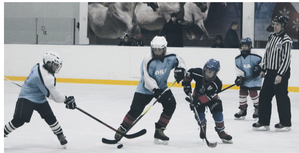
▲ Борьба была яркой и напряженной