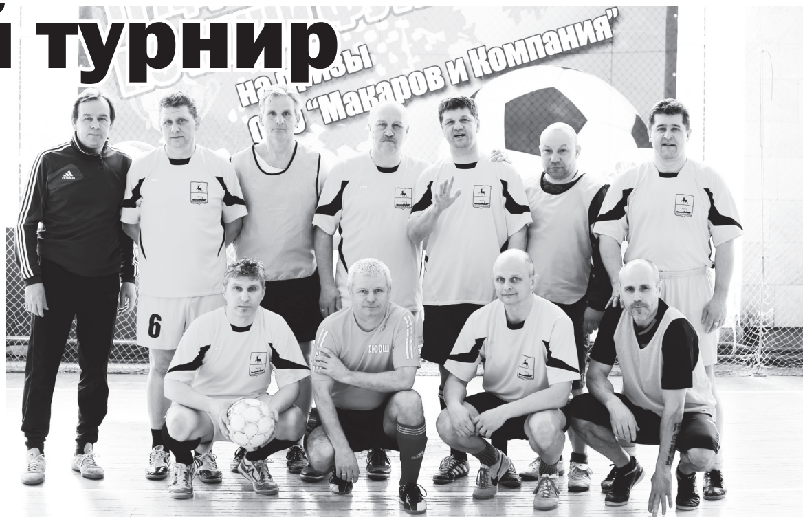
▲ Команда ветеранов мини-футбола городского округа Навашинский