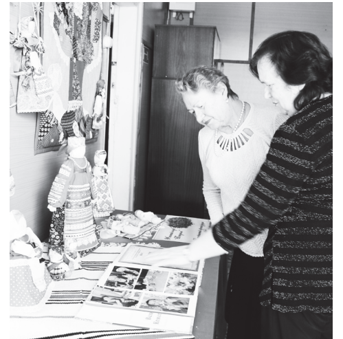
▲ С обзором в Совете ветеранов