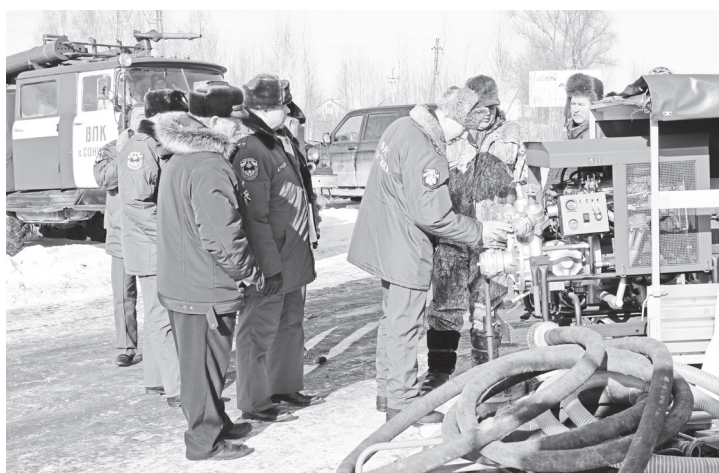
▲ Проверка готовности техники к чрезвычайной ситуации

В рамках работы комиссии МЧС России по проверке готовности органов управления, сил и средств звена городского округа территориальной подсистемы РСЧС Нижегородской области 27 февраля в администрации округа состоялось заседание комиссии по чрезвычайным ситуациям.