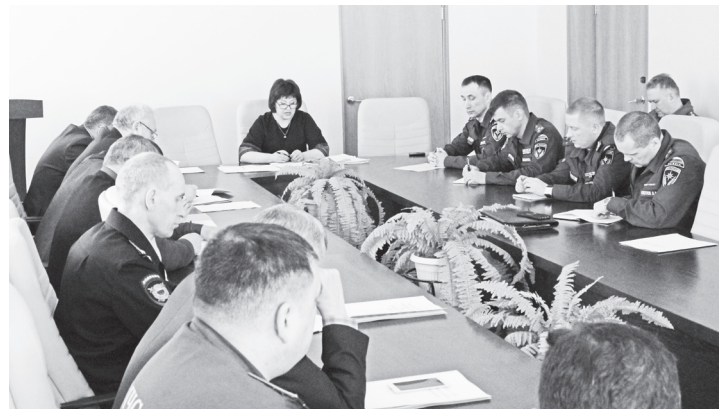
▲ На заседании комиссии присутствовали представители администрации и руководители служб округа