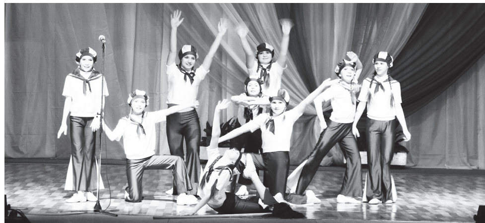
▲ Зажигательный танец в подарок от танцевального коллектива «Серпантин»