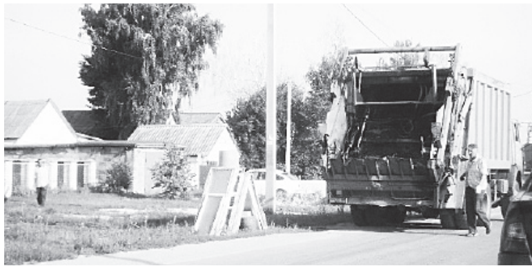
▲ Вывоз ТБО - согласно графику

- Население нашего города может теперь оплачивать данный вид услуги в отделениях Сбербанка и Саровбизнесбанка,