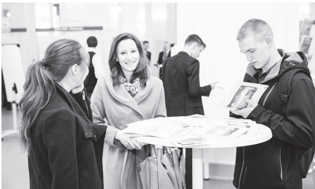
▲ День открытых дверей

Рано или поздно, работу приходится искать практически всем. Существует множество способов поиска, но помочь безработным гражданам найти нужное место работы всегда готовы специалисты Центра занятости населения городского округа Навашинский. Но помощь, оказываемая службой занятости, не может быть одинаковой для всех граждан. Так, на базе Центра занятости населения состоялось два мероприятия: День открытых дверей для граждан предпенсионного и пенсионного возраста и мини-ярмарка вакансий рабочих мест для родителей, воспитывающих несовершеннолетних детей.