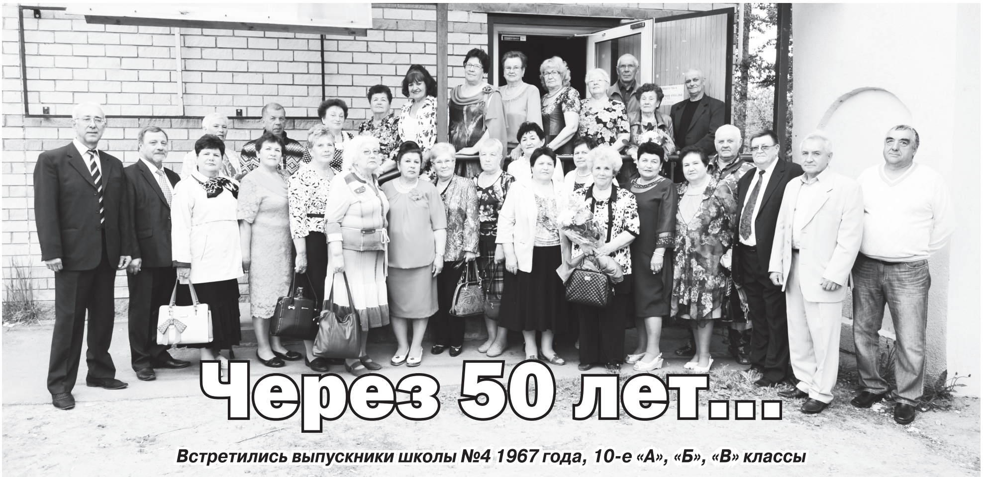
Через 50 лет... Встретились выпускники школы №4 1967 года, 10-е «А», «Б», «В» классы