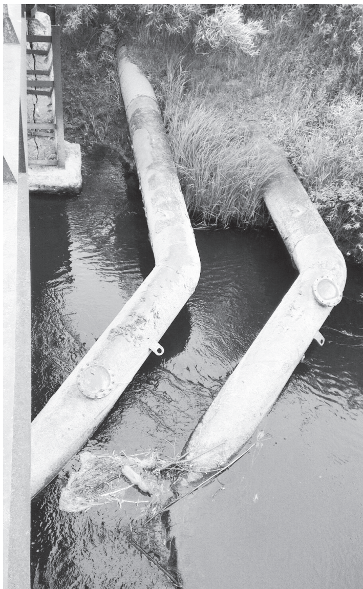
▲ Ситуация с качеством сточных вод находится на контроле федеральных и региональных надзорных органов

Чтобы прояснить ситуацию с качеством сбрасываемых вод, мы направили запрос в министерство экологии и природных ресурсов Нижегородской области. Нами был получен следующий ответ. Аккредитованная лаборатория подведомственного минэкологии ГБУ НО «Экология Региона» согласно государственному заданию осуществляет мониторинг водного объекта р. Велетьма. В рамках мониторинга был произведен отбор проб природной воды р. Велетьма в месте сброса сточных вод ООО «Водоканал» 22 марта и 25 мая 2017 года. Согласно результатам анализов природной воды имеются превышения по ряду показателей содержания загрязняющих веществ относительно предельно допустимых концентраций, установленных для водных объектов рыбохозяйственного значения, причем более поздние исследования показывают ухудшение качества воды по нефтепродук-