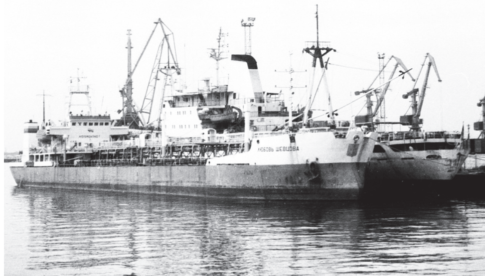
▲ «Любовь Шевцова»