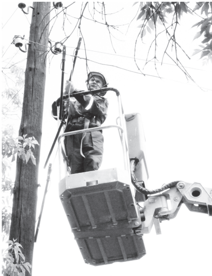
▲ Работы по кронированию деревьев по ул.Ленина