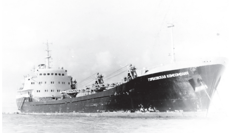
▲ «Горьковская комсомолия» в Средиземном море. 1970 г.