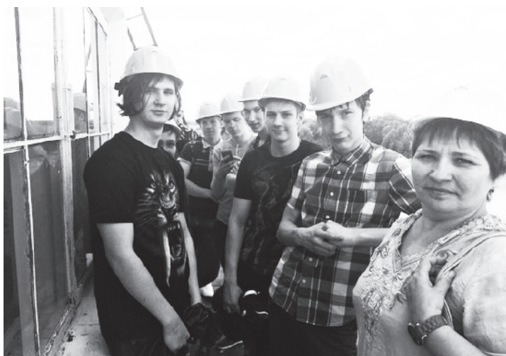
▲ Студенты техникума – надежный кадровый потенциал