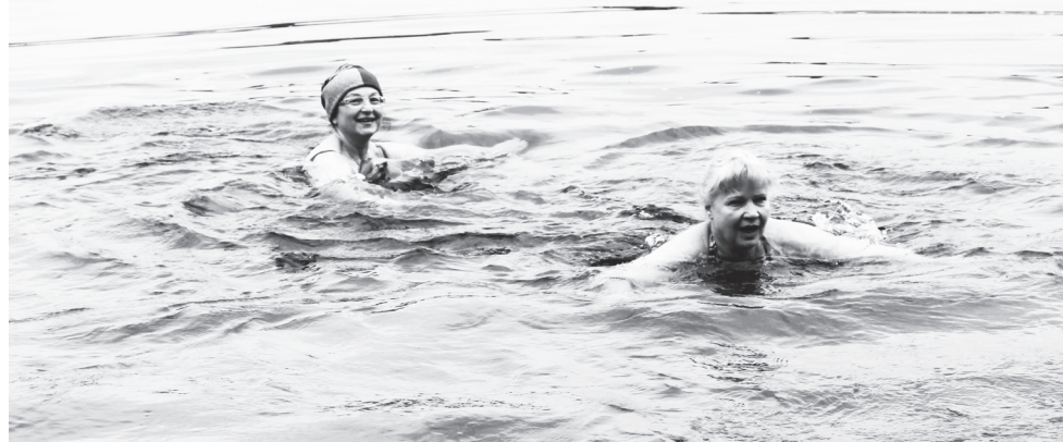
▲ Вода в озере Свято - ласкающая, бодрящая