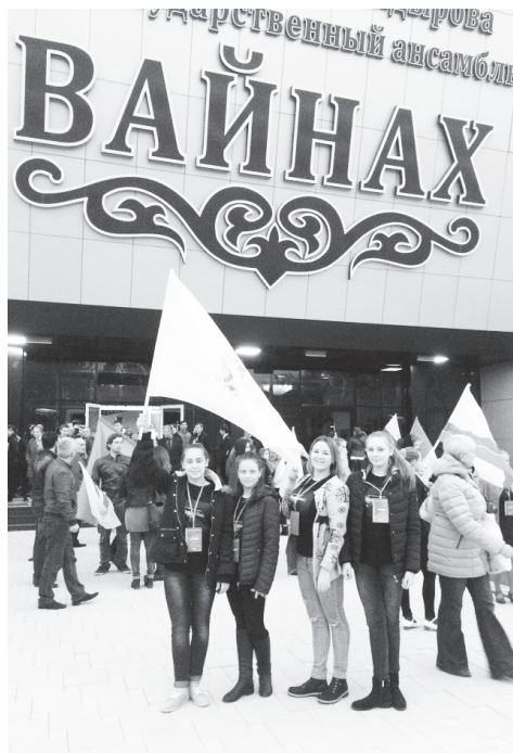
▲ Артистки ансамбля «Экспрессио» Б-Окуловского Дома культуры достойно представили округ на конкурсе в Грозном