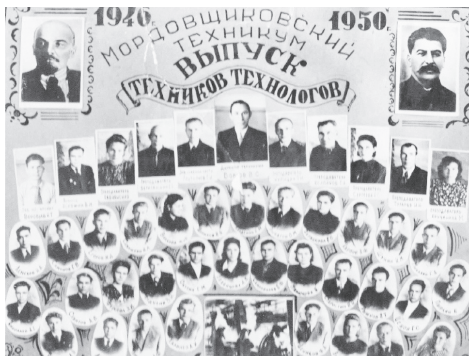
▲ Первые выпускники