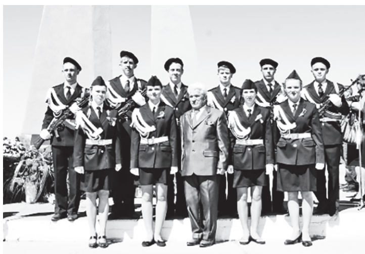
▲ Военно-патриотическое объединение «Орленок» – у обелиска «Славы» в День Победы