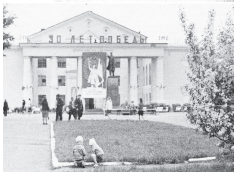
▲ Дворец культуры в годы руководства Станислава Нефедова