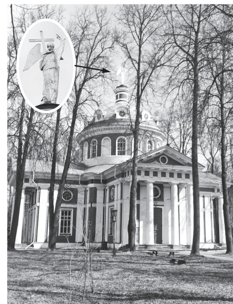
▲ Церковь Гребневской Божией Матери

Яркой вспышкой остаются в памяти неизгладимые впечатления от путешествий к истокам Родины. Эти частички истории, как незамутненные источники, прозрачные ручьи, очищают душу и наполняют светом. И вновь предстают взору купол церковного храма, венчаемый фигурой архангела (большая редкость для России). Таков он у церкви Гребневской Божией Матери, построенной первой. Имена двад-