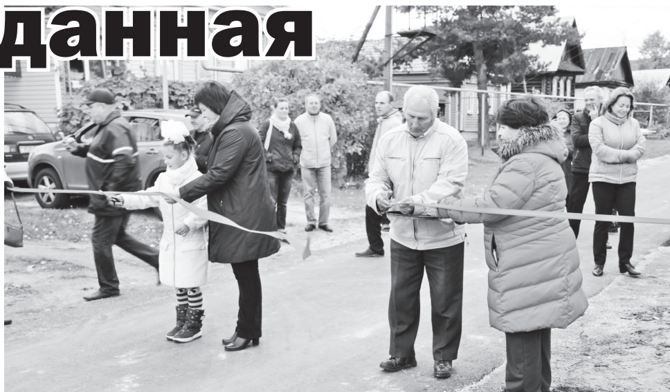
▲ Дорога открыта!

– Сердце любого населенного пункта – это его жители. И именно от них зависит комфорт и окружающая среда населенного пункта. И сегодня в маленькой деревне с красивым названием Ярцево знаменательное событие – открытие новой асфальтированной дороги. Благодаря вашей инициативе нам удалось реализовать данный проект. Программа поддержки местных инициатив в Нижегородской области работает с 2013 года, а городской округ Навашинский участвует в ней с 2014 года. В рамках этой программы реализовано много проектов, построено много дорог в сельских населенных пунктах: селах Боль-