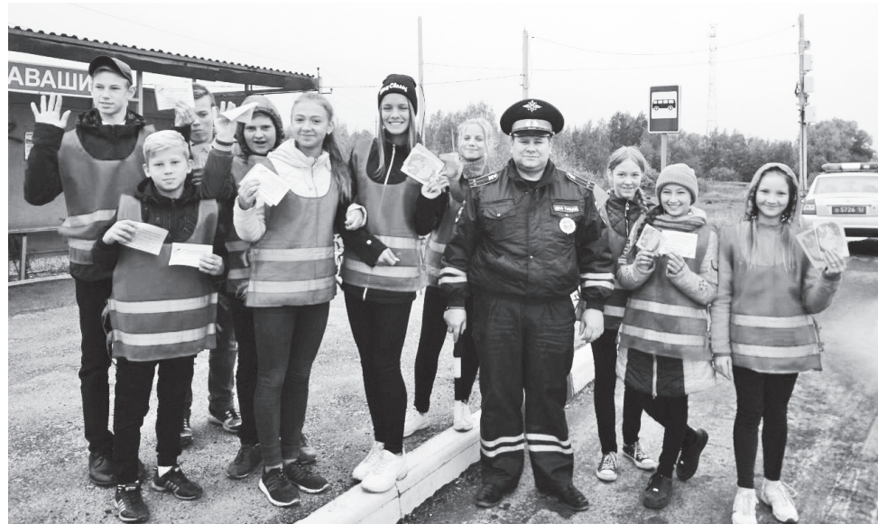
▲ Ребята из отряда ЮИД Б-Окуловской школы

Остановившая проезжающую мимо автомобиль, инспекторы ОГИБДД разъясняли водителям ответственность за нарушение ПДД, а ЮИДовцы вручали листовки с пожеланиями безаварийных дорог.