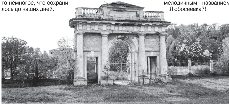
▲ Ворота на въезде в усадьбу

Впервые усадьба упоминается в писцовых книгах XVI века. Ее хозяином был тогда Богдан Бельский – оружничий самого Ивана Грозного. С течением времени хозяева менялись. Это были и князья Трубецкие, и Голицыны, и прочие. В свое время здесь любили проводить свободное время знатные особы, собиралась, как сказали бы сейчас, богема. И немудрено. Как же не влюбиться в это завораживающее, утопающее в зелени роскошного парка творение человека у речки с мелодичным названием Любосеевка?!