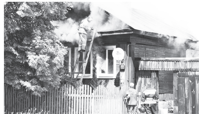
Дарья ВИЛКОВА Фото автора

тушении пожара было задействовано три единицы техники и 10 пожарных. Предположительная причина пожара - короткое замыкание, но на данный момент по этому факту проводится следствие.