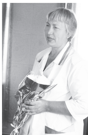
ный труд в сфере здравоохранения и в связи с праздником.

16 сотрудникам были вручены грамоты и выражена благодарность от руководства больницы за многолетний добросовест-