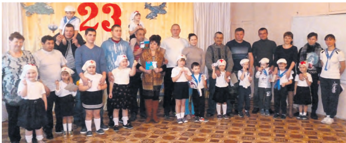
▲ Мама и папы с удовольствием участвуют в мероприятиях детского сада

Ксения ПИСКУНОВА