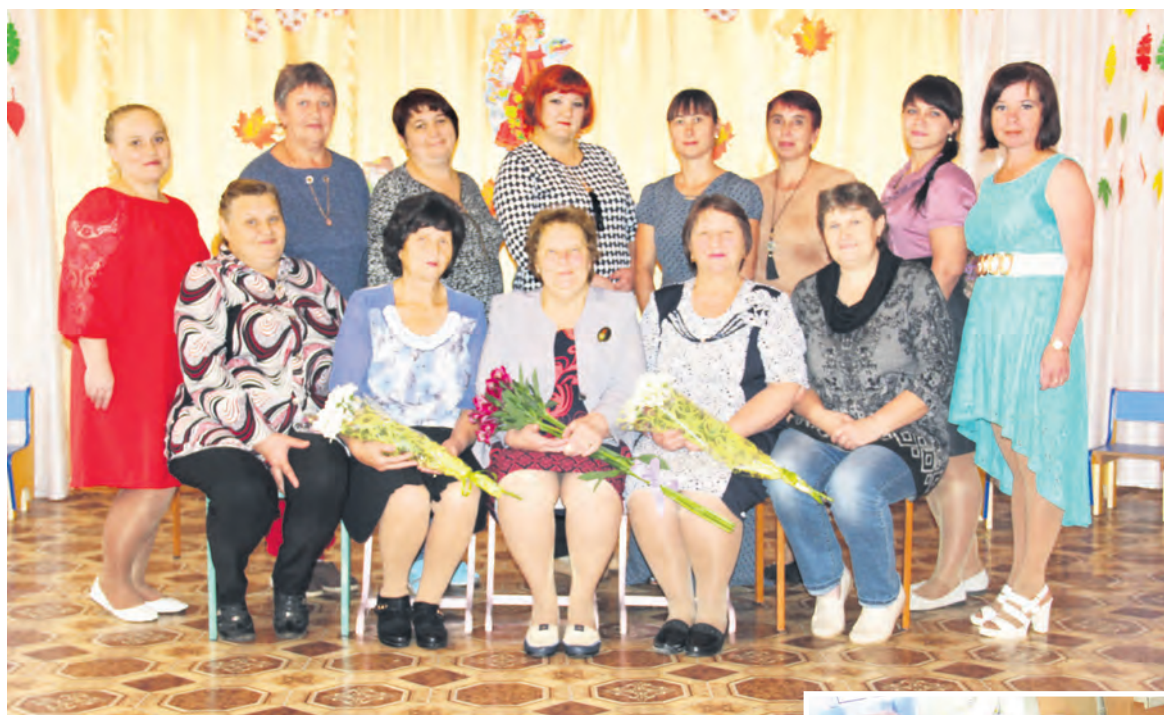
▲ «Это наша вторая семья...»