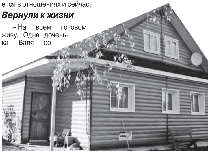
▲ Таким обустроенным и комфортным стал дом юбиляра благодаря детям