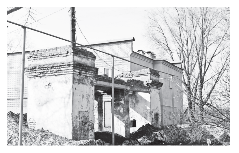
🛦 Так выглядела арка 5 лет назад