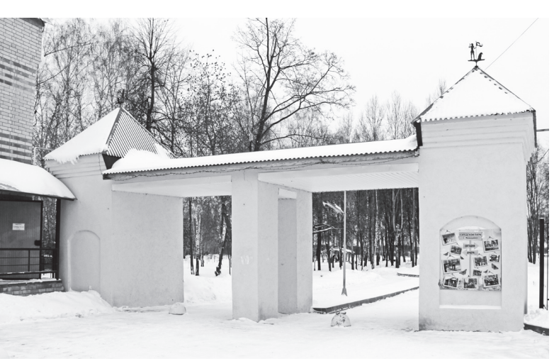
🛦 А такой вид она приобрела после реконструкции