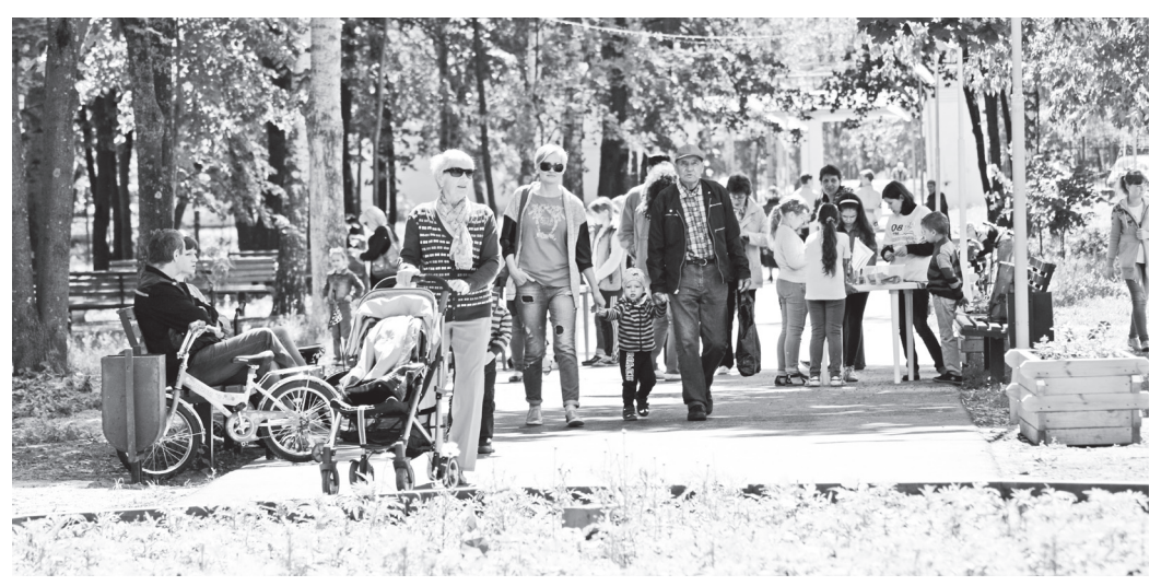
🛦 Городской парк – место массового отдыха