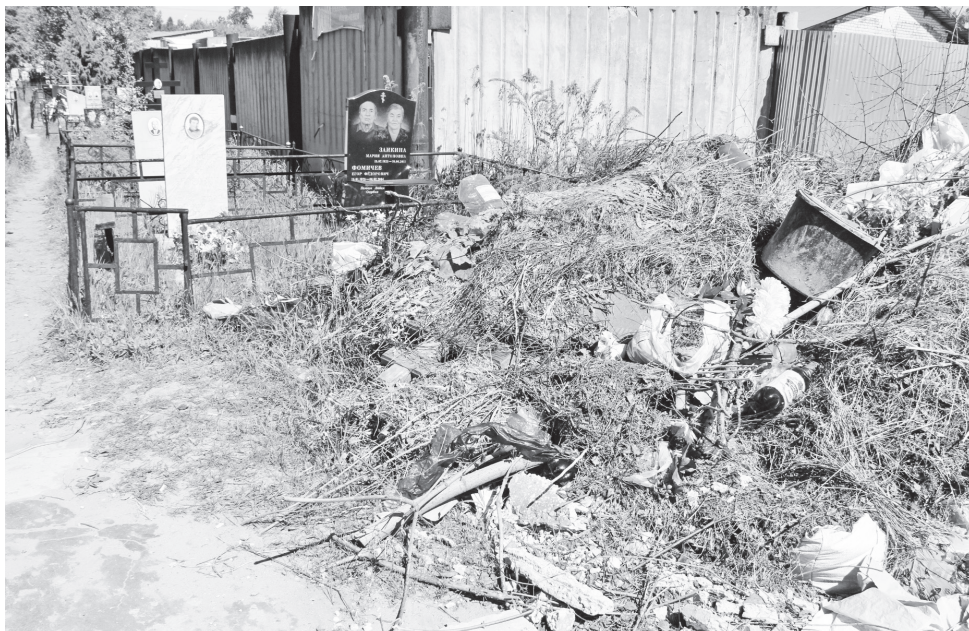
▲ Свалка буквально «наползает» на ограду и могилы