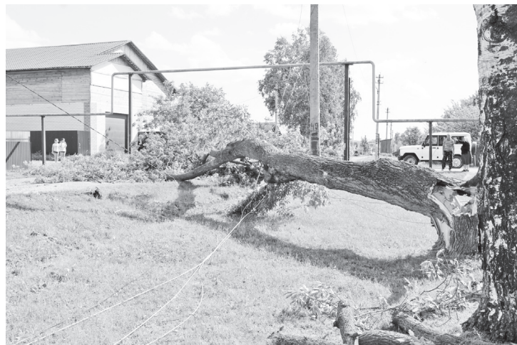
▲ Улица Полевая