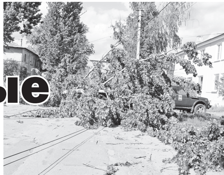
▲ Улица Ленина

По информации пресс-службы губернатора и правительства области, от штормо-