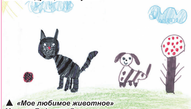
▲ «Мое любимое животное» Максим Гафуров, 7 лет

Рисунки остальных участников будут размещены в следующем выпуске.