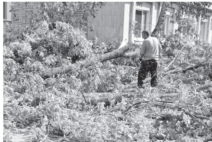
▲ Улица Почтовая