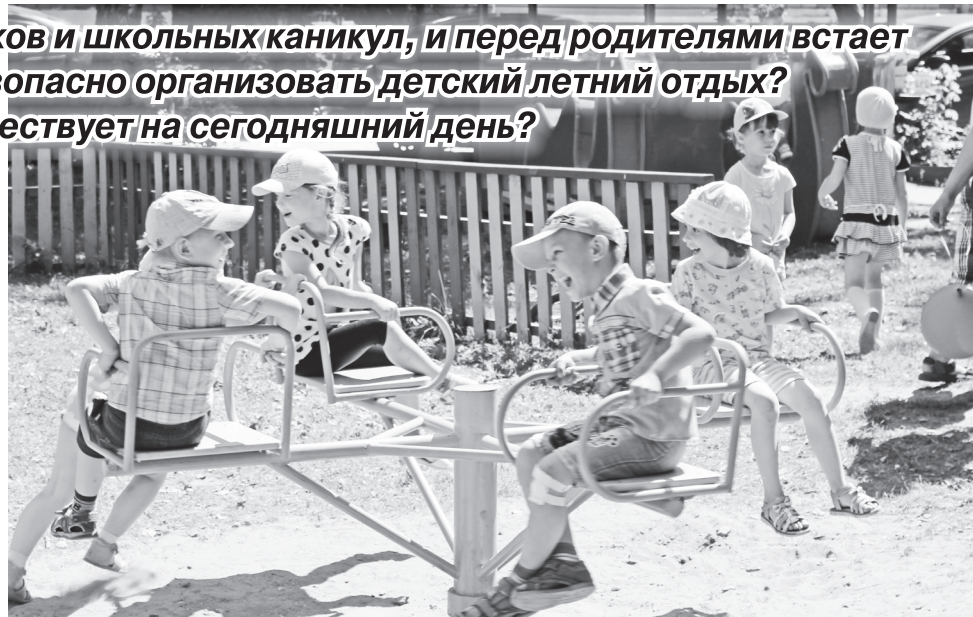
▲ Чтобы было весело и безопасно

Согласно закону, родители будут заранее знать об особенностях природных, климатических условий, зонах повышен-