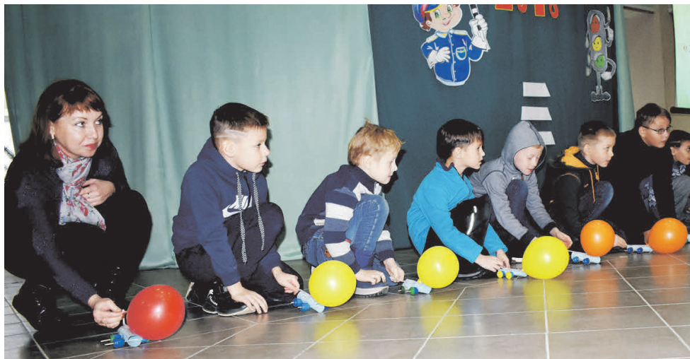
▲ Еще несколько секунд... и шарикомобили стартуют

В нем приняли участие обучающиеся образовательных организаций городского округа Навашинский. Эти соревнования посвящались юбилейной дате в автомобилестроении – 85-летию первого троллейбуса в России.