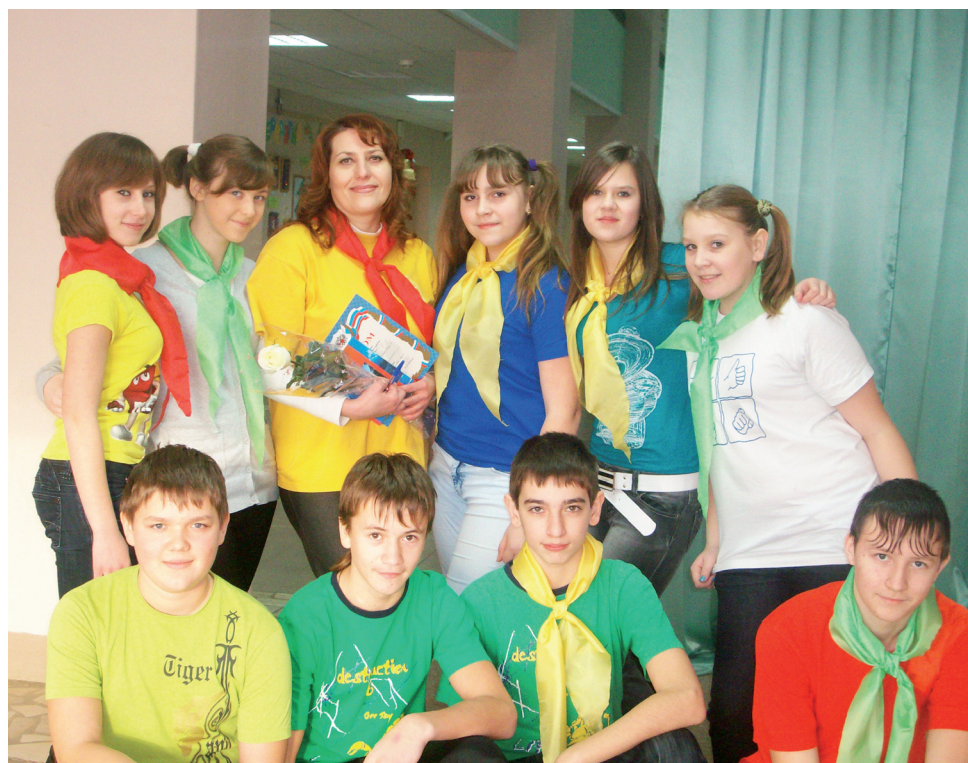
▲ «Вожатыми не становятся, вожатыми рождаются»

– Начинала с вожатого школьного лагеря «красной» школы (сейчас это гимназия). С 1992 года работала вожатой в загородном лагере. Тогда я поняла, что эта профессия интересная и даже необычная, но в тоже время не такая уж