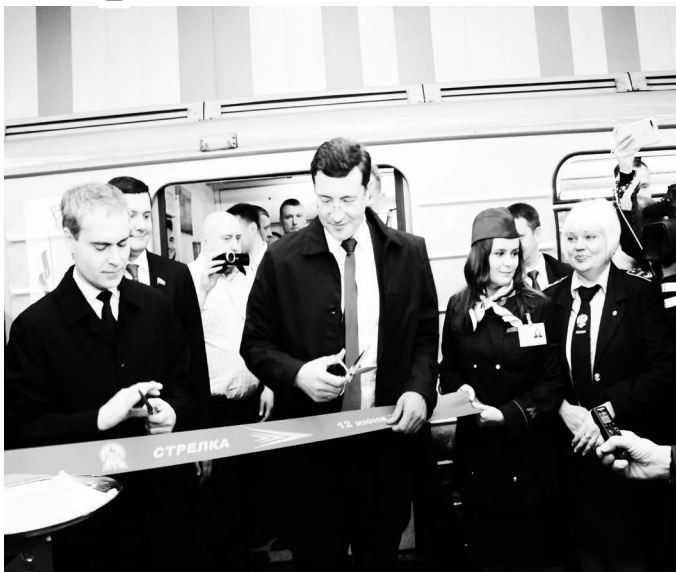
▲ Глеб Никитин торжественно открывает станцию метро «Стрелка»