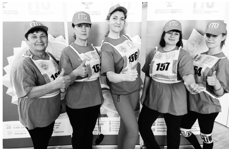
▲ Участники Летнего фестиваля ГТО

В целом участники команды продемонстрировали хорошую физическую форму и показали неплохие результаты, проявив и волю к победе, и азарт, и желание справиться с испытаниями, несмотря