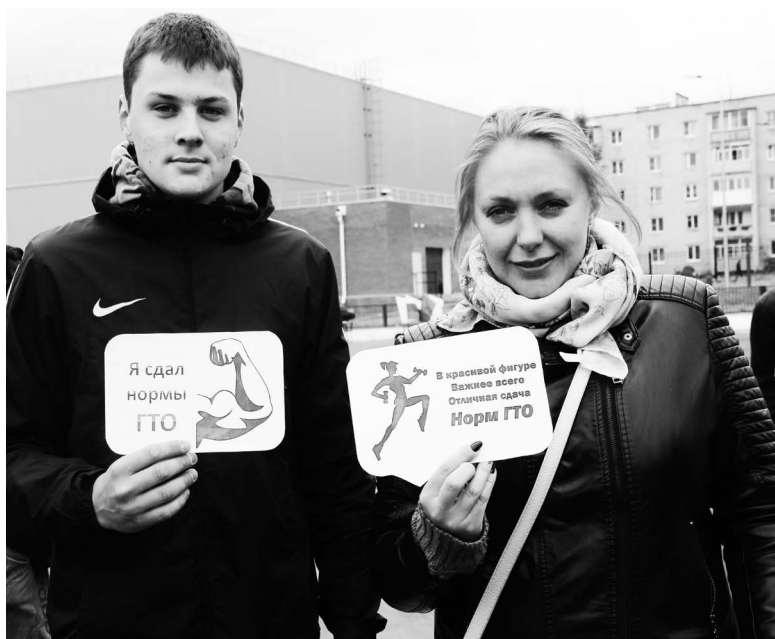
▲ Мы сдали нормы ГТО. А ты?

Анна КИРИЛЛОВА