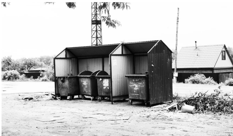
▲ Площадка для мусорных контейнеров на ул. Московская