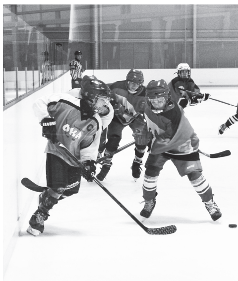
▲ Момент игры