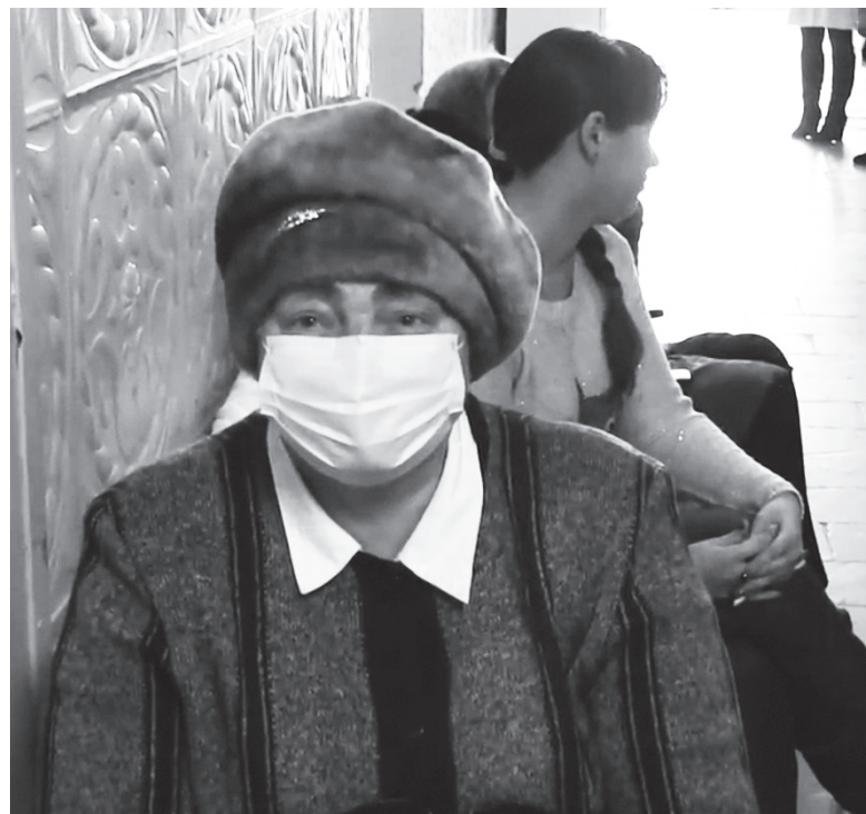
▲ Главное - не забывать о профилактических мерах

Неблагополучная эпидемиологическая обстановка сложилась в соседних городах. С 29 января в городском округе Муром во всех школах были введены внеочередные каникулы, а также наложен запрет на проведение массовых мероприятий. А с 25 января на территории Владимира также был введен комплекс мероприятий по предупреждению распространения гриппа и ОРВИ. Учитывая высокую вероятность распространения гриппа на территории городского округа Навашиный, возможно, что в ближайшие дни у нас тоже будет введен карантин. Врачи Навашиной ЦРБ напоминают жителям, что не так страшен сам грипп, как его осложнения, которые несут смертельную угрозу. Наиболее частой причиной смертельных исходов при гриппе является пневмония. Также его осложнения чреваты отитом, трахеитом, ринитом, миокардитом, менингитом, обострением имеющихся хронических заболеваний и др. Безусловно, наиболее защищенными от гриппа слоями населения являются те, кто заблаговременно сделал прививки. Тем же, кто подошел к периоду подъема заболеваемости ОРВИ и гриппом неподготовленным, остается принимать меры неспецифической профилактики