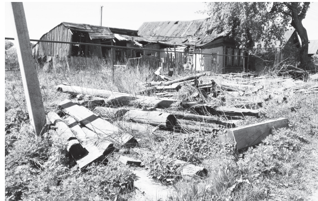
▲ Самая настоящая свалка у дома по ул.Калинина

Если складированные строительные материалы портят внешний облик улицы и не несут никакой угрозы, то упавший старый трухлявый забор и изрядно прогнившие доски и бревна вперемешку с сухой травой служат хорошим горючим материалом.