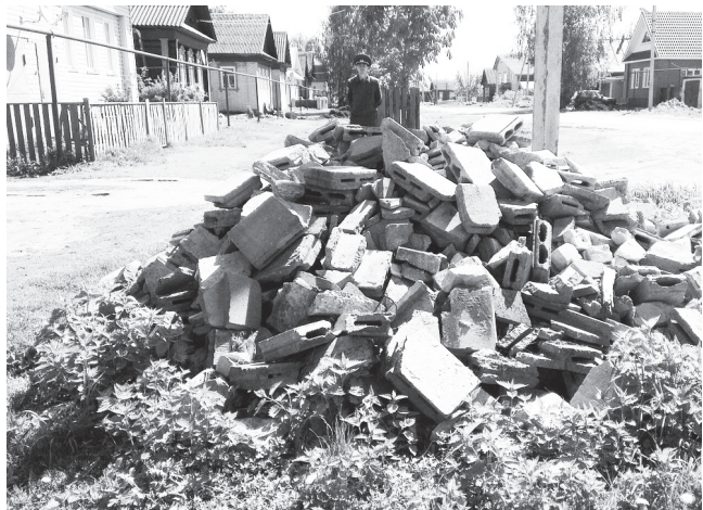
▲ Груда кирпичей не украсит внешний вид селения