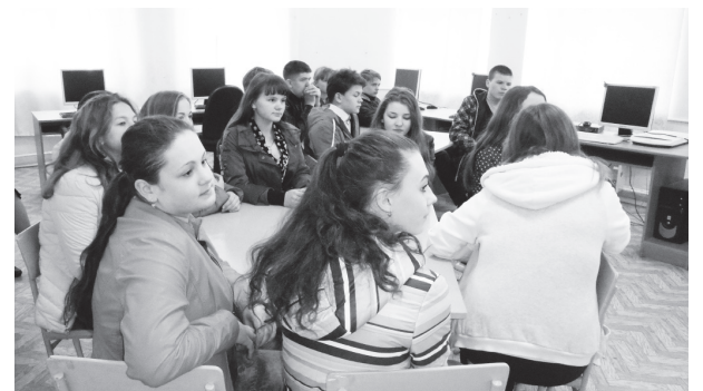
▲ Учащиеся школы №3 во время групповой работы

19 мая на базе Навашинского центра дополнительного образования детей состоялся тематический урок, посвященный Международному дню детского телефона доверия.