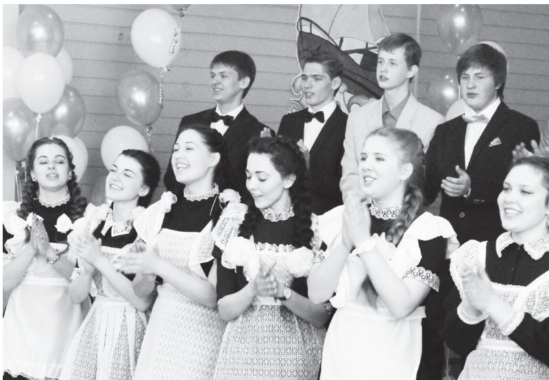
▲ Поют выпускники школы №4

- От имени администрации Навашинского района я хочу поздра-