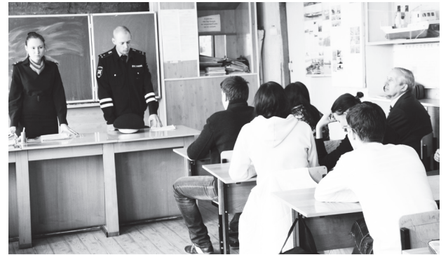
▲ На уроке безопасности в техникуме

Сотрудники навашинской полиции провели в рамках месячника безопасности дорожного движения профилактическую беседу со студентами техникума.