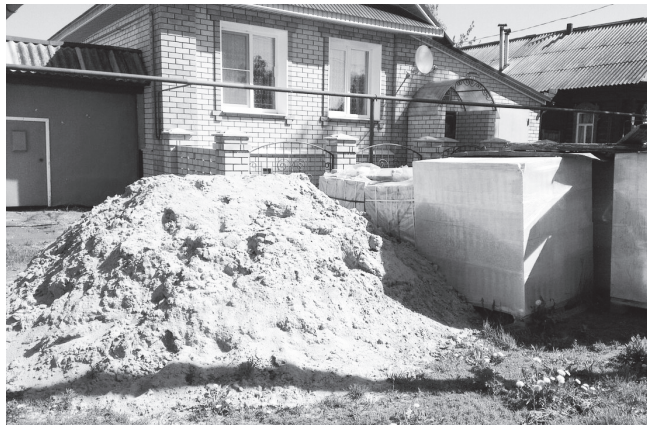
▲ Строительным материалам не место!

Центральная улица села - Калинина, буквально увязла в горах песка, щебня, кирпичей и других строительных материалов. Практически возле каждого дома наблюдается такая картина. Это не только портит внешний облик поселения, но и самое главное противоречит правилам благоустройства территории. Власти пытались донести до жителей села, что подобные их действия незаконны. Однако это не принесло никаких результатов. Жители частного сектора попросту проигнорировали эту информацию, как и те уведомления, которые им присылали.