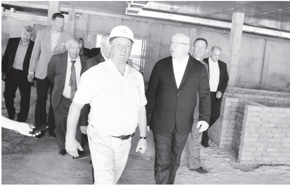
▲ В здании будущего Ледового дворца