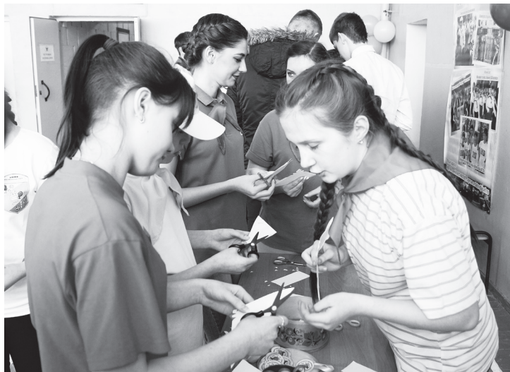
▲ Мастер-класс «Юбилейный журавлик»

Илья КАССИН. Фото предоставлено Дворцом детского творчества