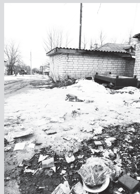
Валерия РУДОМЕТОВА

Хочется надеяться на то, что будут сделаны правильные выводы, не будет забыта истина: в любой ситуации следует оставаться человеком!