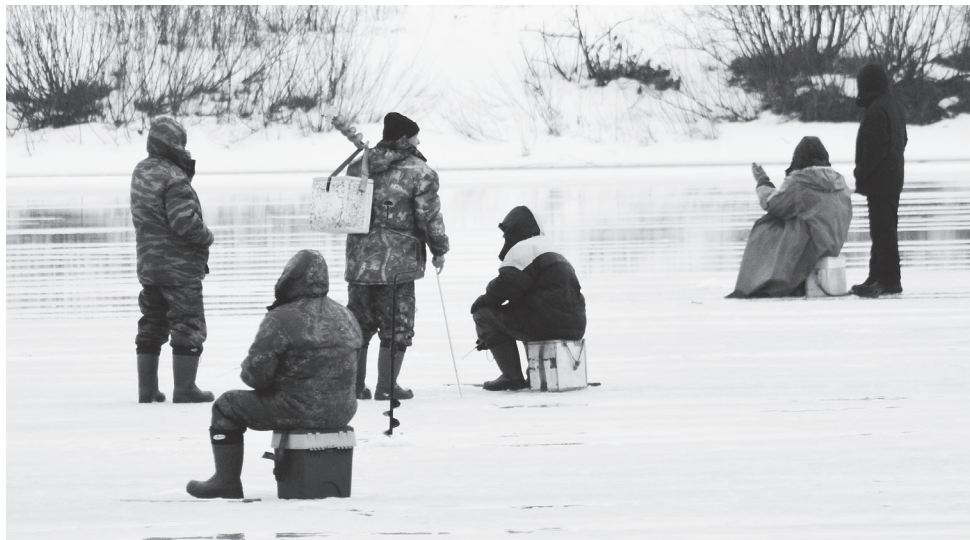
▲ Рискую жизнью

В случае возникновения угрозы затопления жилых территорий и производ-