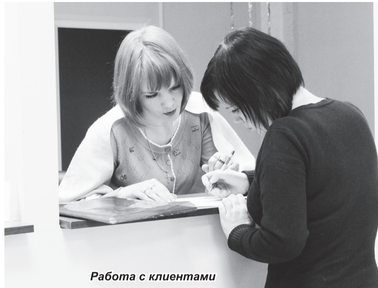
Работа с клиентами

- В селах Большое Окулово и Натальино в зданиях сельских администраций были созданы