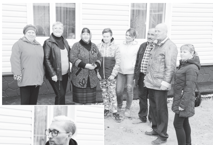
▲ Жильцы дома не жалели теплых слов благодарности в адрес подрядчиков

переживали, так как не знали, что из этого может получиться. Но видя, как с каждым днем он преобразуется, мы успокаивались, а уверенность в том, что все будет сделано на высшем уровне, только прибавлялась, – делятся впечатлениями жильцы.