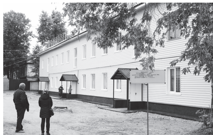
▲ Так выглядит дом №3 по ул. Соболева после капитального ремонта

– Мы очень рады, все получилось, как нельзя лучше. Благодарны администрации городского округа Навашинский за то, что быстро приняли решение по ремонту нашего дома, и подрядной организации, работники которой с раннего утра и до позднего вечера трудились на этом объекте. Работа сделана добросовестно. Когда нам только начали ремонтировать дом, мы очень