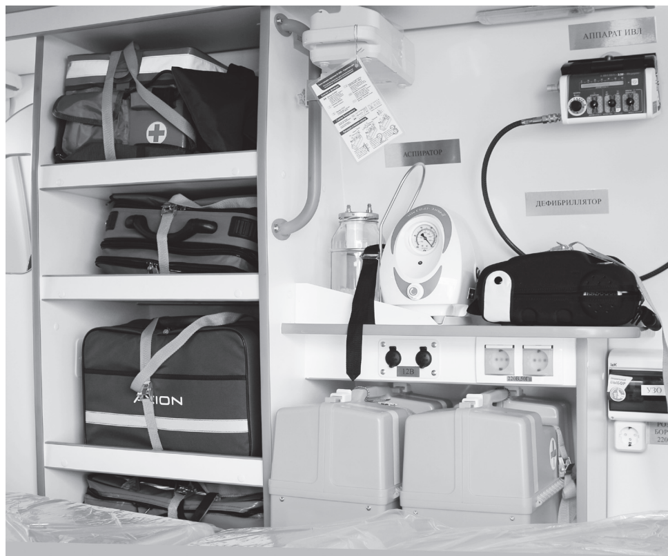
▲ Современное медоборудование в новом автомобиле «скорой помощи»