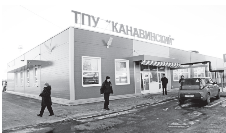
▲ Новый объект

«Объект построен за счет средств инвестора «Волго-Вятская пригородная пассажирская компания» – и это очень хорошо, что есть инвесторы, которые вкладывают деньги в развитие города и дорожной отрасли в целом, ведь транспортная инфраструктура – одна из ключевых сфер хозяйства. Мы будем продолжать работать над созданием транспортно-пересадочных узлов и других объектов дорожной инфраструктуры, которые создадут безопасные и комфортные условия передвижения для нижегородцев и наших гостей. В ближайшее вре-