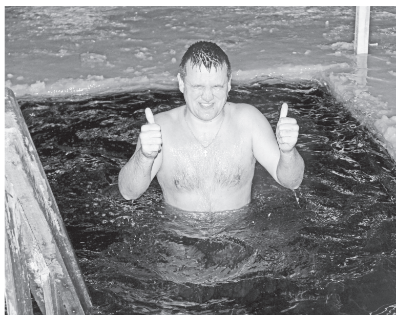
▲ В день Великого Крещения

– Окунаясь в прорубь в Крещенскую ночь я не первый год, это уже стало некой традицией в нашей семье. Сначала мы едем в церковь на службу, а потом уже на прорубь. Самое главное для меня в этом деле – моральный настрой. На озере Святое все предусмотрено для купающихся в эту ночь – около оборудованной проруби дежурят спасатели, подъезд расчищен, есть освещение. После окунания резкий прилив сил и покальвание по всему телу. Горячий чай из термоса, привезенный из дома, добавляет приятных ощущений, – рассказывает жи-