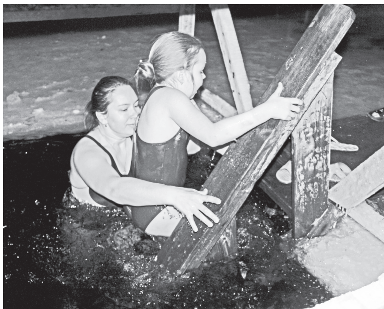
▲ Первое купание в крещенской воде