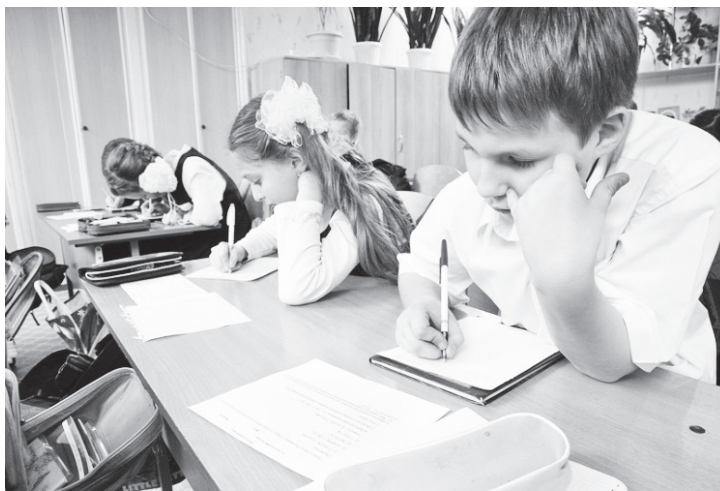
▲ По результатам ВПР не принимаются никакие обязательные решения, важные для определения дальнейшей судьбы и образовательной траектории школьника

Первыми предстоит написать ВПР по шести учебным предметам выпускникам. В 11 классах они проводятся по решению школы для учащихся, которые не выбрали данные предметы для сдачи в форме ЕГЭ. 20 марта для одиннадцатиклассников пройдет ВПР по иностранному языку (английскому, немецкому и французскому), 21 марта – по истории, 3 апреля – по географии (может проводиться как в 11, так и в 10 классах в зависимости от учебного плана школы), 5 апреля – по химии, 10 апреля – по физике, 12 апреля – по биологии. ВПР для 4 классов откроет русский язык: первую часть работы учащиеся напишут 17 апреля, вторую – 19 апреля.