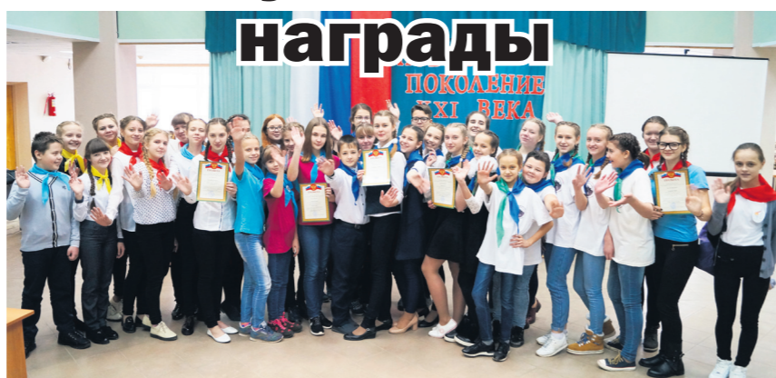
▲ Участники конкурса

28 ноября во Дворце детского творчества состоялся муниципальный этап ежегодного областного конкурса «Новое поколение XXI века». Он проходил среди лидеров детских общественных объединений и Советов учащихся образовательных учреждений в двух номинациях: «Лидеры-старшеклассники» и «Лидеры детских общественных объединений». Согласно результатам конкурса, в каждой из номинаций компетентным жюри были определены победители и призеры.