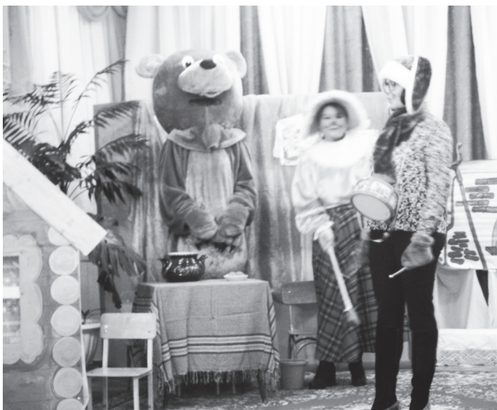
▲ Спектакль, в котором персонажей играют мамы

Антонина КУЛИКОВА