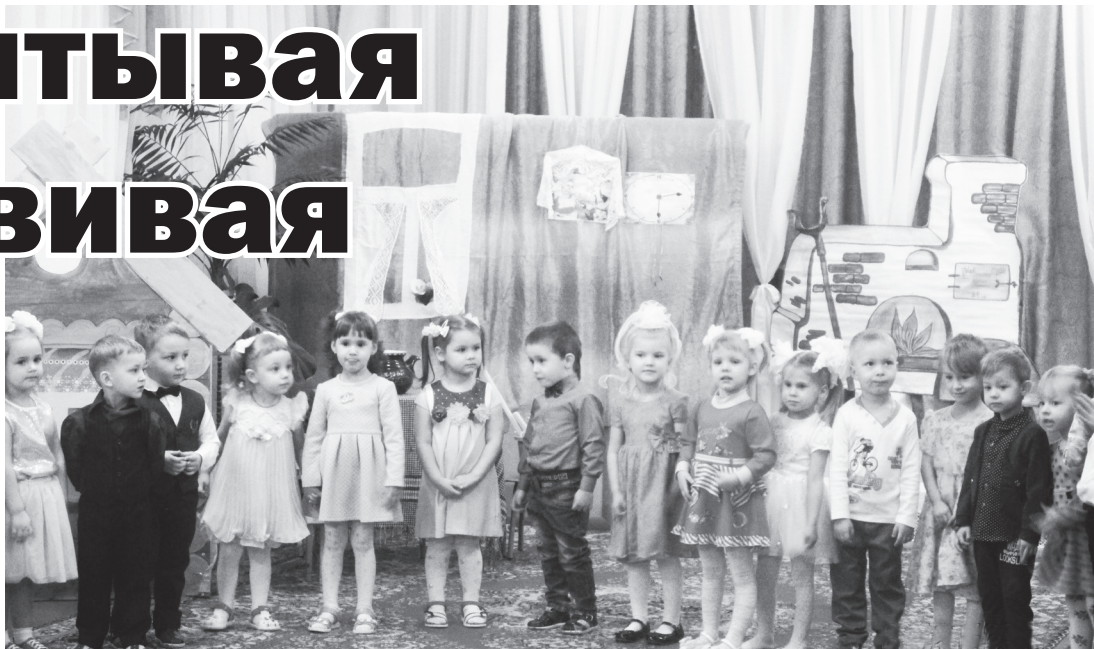
▲ Театр – это всегда праздник. С ним связаны радость, веселье, яркие впечатления, новые чувства. И как интересно быть не только зрителем, но и участником спектакля!

На призовые средства детский сад предполагает приобрести театральные принадлеж-