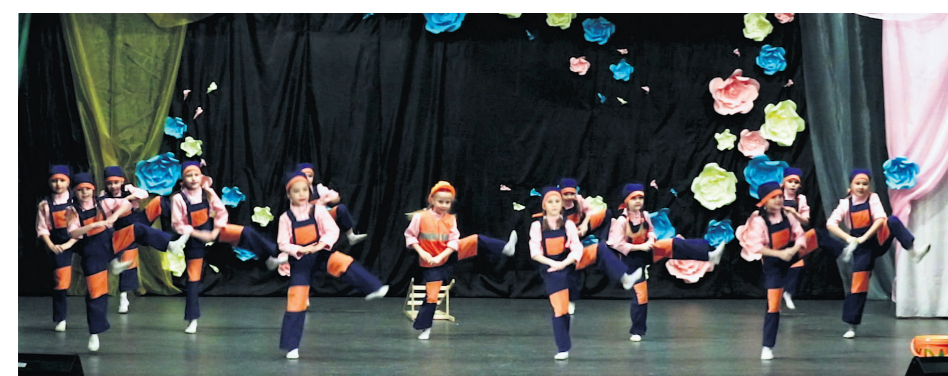
▲ «Серпантин» дарит зрителям зажигательный танец

С годами, став взрослее, в чувствах строже, Вдруг сердцем начинаешь понимать: Нет человека ближе и дороже, Чем женщина, которой имя – Мать. Лариса ЛЯЛИНА