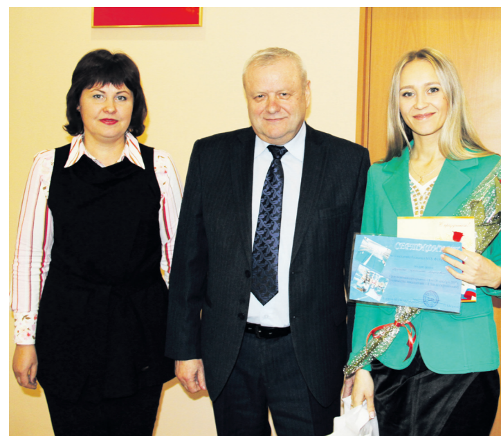
▲ Каждой маме – цветы и подарки от представителей власти