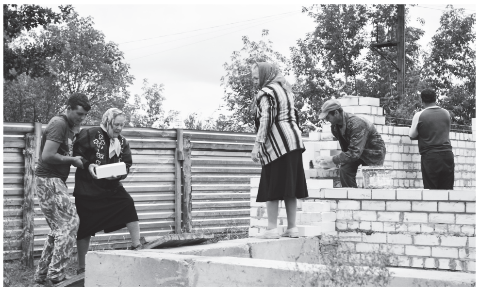
▲ Испокон веков церкви на Руси строили всем миром. Особой формой благотворительности были пожертвования «на кирпичик»

Подготовила Лидия СЕРГЕЕВА