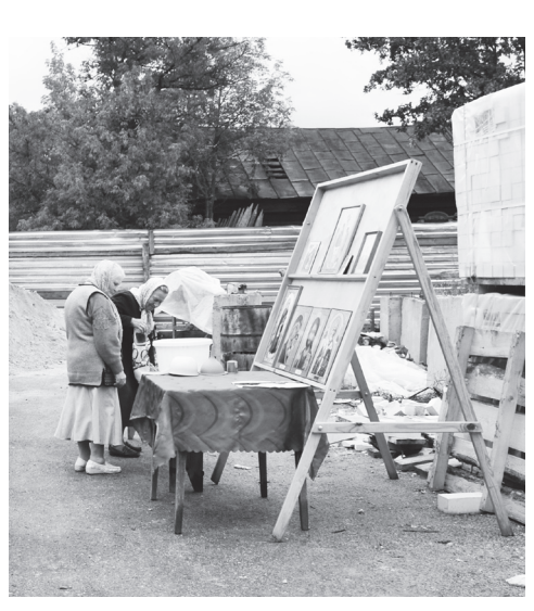
▲ Каждое воскресенье в 13.30 на территории строящегося храма ведется богослужение

В настоящее время кладка цокольного этажа завершается. До начала холодов необходимо смонтировать его перекрытия, на что тоже потребуются средства.