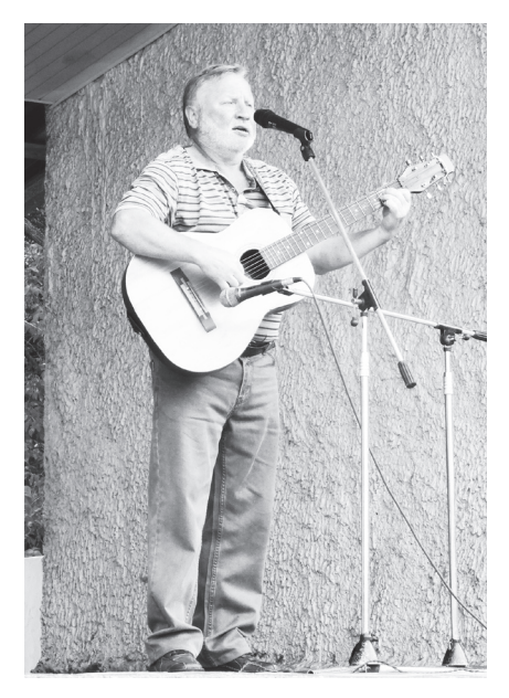
▲ В песнях о главном - для молодых

3 сентября отмечалась особая дата - День солидарности в борьбе с терроризмом. В этот день на главной площади управлением культуры, спорта и молодежной политики была организована акция, на которую были приглашены ученики образовательных учреждений округа.