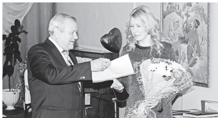
▲ Поздравления от руководителей округа

коллектив одержал победу в областном конкурсе на лучшую постановку по экологическому воспитанию.