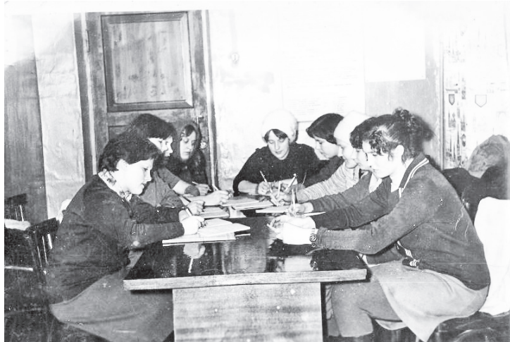
▲ На политзанятиях в конторе общепита