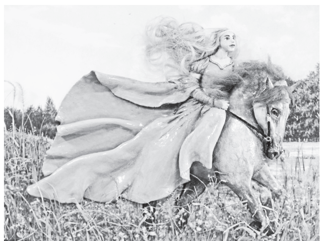
▲ Панно в номинации «Художественная лепка»

198 учащихся из 11 образовательных организаций округа представили 229 поделок по 6 номинациям: «Декоративная роспись», «Художественная лепка», «Кукла», «Игрушка», «Вышивка», «Миниатюра». Приятно