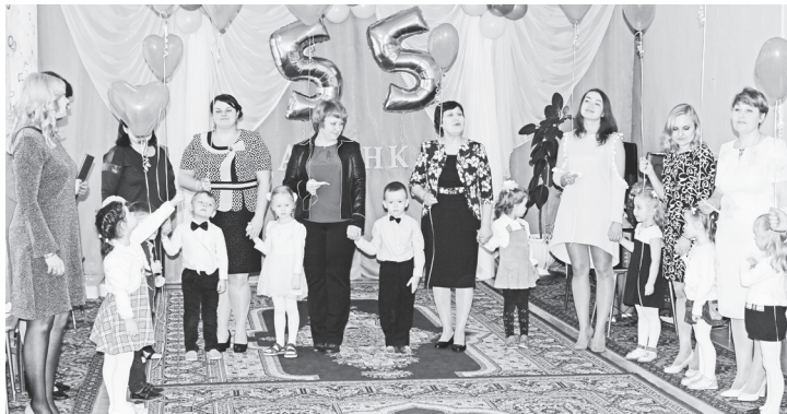
▲ На праздничном концерте

На участке детского сада совместным трудом с родителями посажена аллея кленов и лип, которые радуют своей зеленью и укрывают от яркого солнца. Опыт работы с родителями опубликован в книге «Год экологии детям!», изданной Нижегородской областной организацией «Всероссийское общество охраны природы». Благодаря участию в экологическом проекте «Вместе бережем птиц родного края»