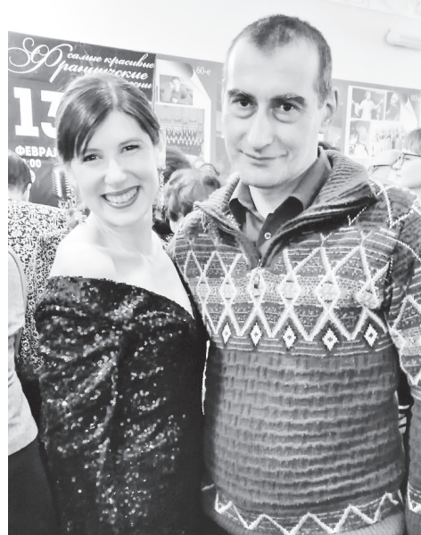
▲ Общение певицы со своей публикой продолжилось и после концерта. Она охотно фотографировалась, раздавала автографы