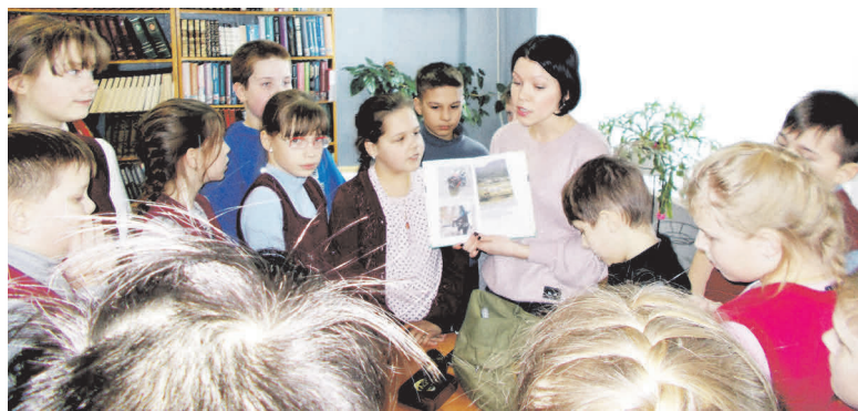
▲ В поисках спрятанного знамени