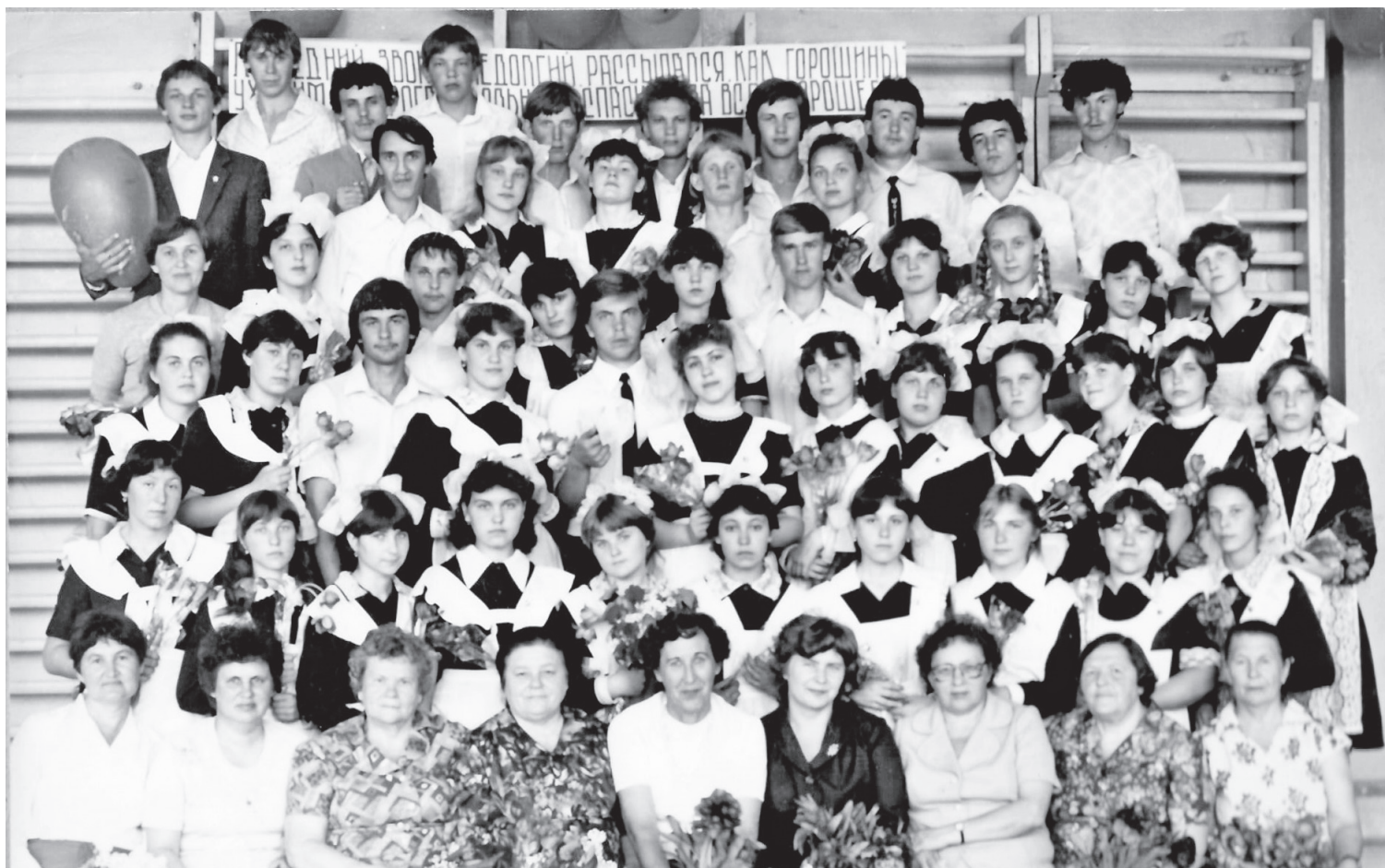
▲ 25 мая 1984 года. Для наших десятых классов «А» и «Б» в последний раз прозвенел звонок. На этом фото мы все вместе. До 8 класса в каждом – насчитывалось по 40 учеников