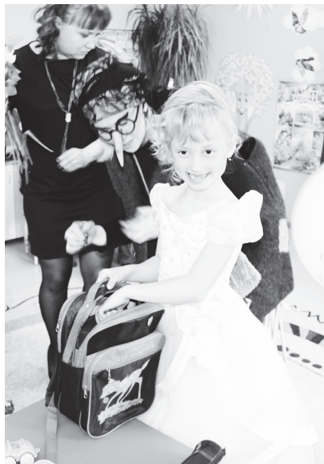
▲ Поздравить ребят пришли персонажи любимых сказок