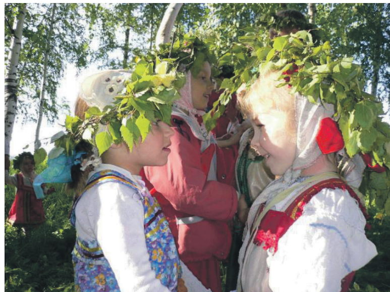
▲ Береза - символ Троицы - одно из первых деревьев покрывается листьями и стоит как самая «нарядная»

В храмах Троицу отмечают с особым почетом. Это один из важных и красивейших церковных праздников. В День Святой Троицы торжественная служба проходит по особому праздничному чину. После Литургии следует вечерня, во время которой