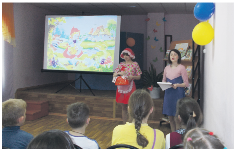
▲ Для юных книголюбов открылись летние чтения

Валерия РУДОМЕТОВА