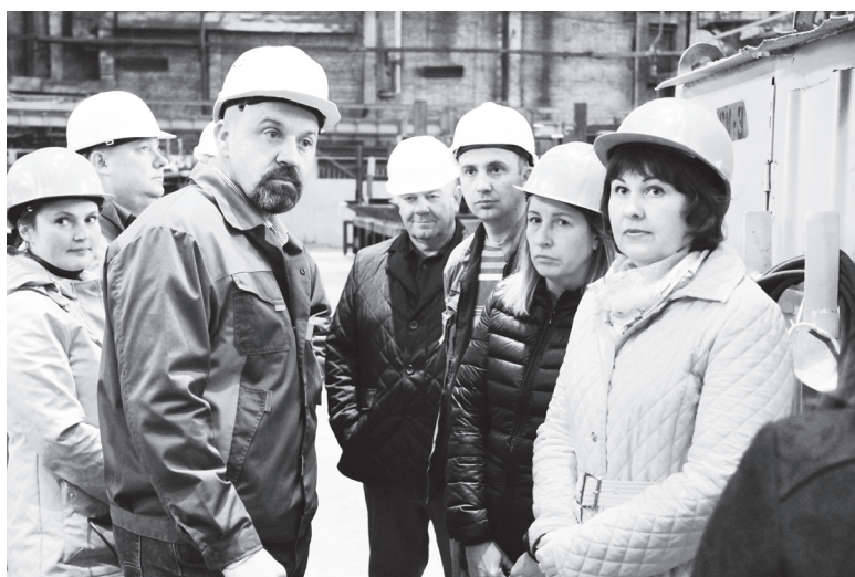
▲ Экскурсия по цехам АО «Окская судовой верфь»

Объектом их интереса в нашем округе стала работа по программе развития моногорода*. Напомним, что с 2014 года городской округ Навашинский является монопрофильным муниципальным образованием. С этого времени муниципалитет совместно с правительством области ведет активную работу, в том числе по созданию условий для реализации инвестпроектов, направленных на обеспечение стабильного развития моногорода. Так, в рамках этих проектов за 2014–2016 годы было привлечено 555 млн руб. инвестиций (в т. ч. 155 – бюджетные средства), создано 174 рабочих места.