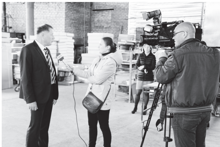
▲ Комментарии журналистам ННТВ дает генеральный директор ООО «ПП Ока-Медик»

Именно по этим объектам и отправились представители администрации вместе с гостями. Первым объектом визита стало АО «Окская судовой верфь» – предприятие с давними традициями судостроения. Верфь долгие годы является крупным производителем и поставщиком речных и морских судов различного назначения. Производственные мощ-