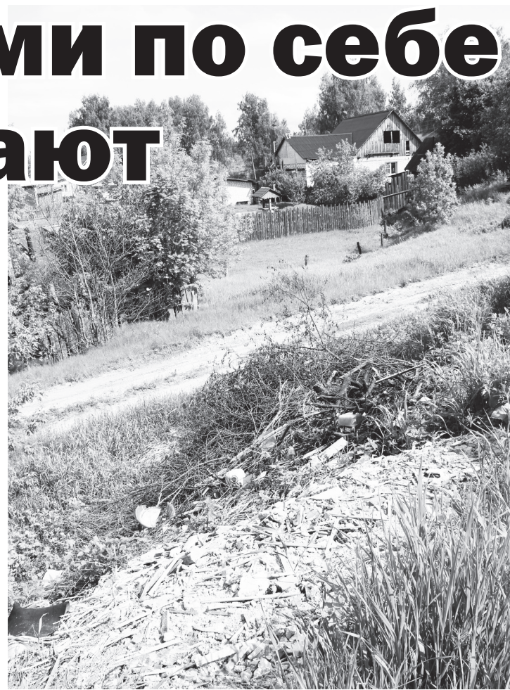
▲ Выбрасывание мусора в неотведенных для этого местах – опасная тенденция, ведущая к загрязнению окружающей среды

Напоминаем, что складирование либо временное хранение, скопление или сжигание