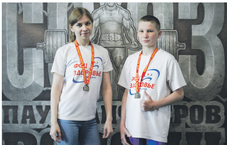
▲ «Навашинские» медали - в копилке сборной Нижегородской области

Ксения ПИСКУНОВА