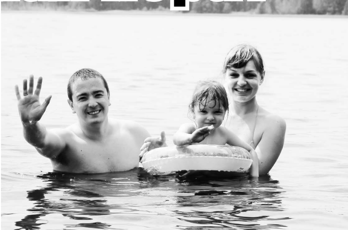
▲ Жители округа в поисках спасения от жары

Если вы почувствовали ухудшение состояния - неза-