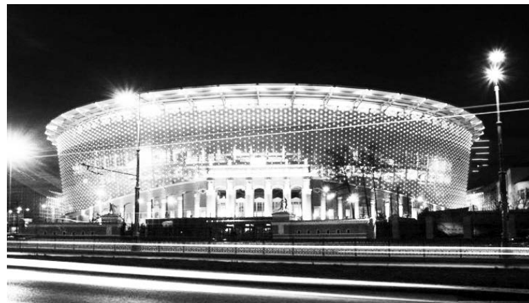
▲ Вид на стадион «Екатеринбург Арена»

возведен на месте бывшего стадиона «Центральный» в Верх-Исетском районе. Вместимость - 35 000 мест.