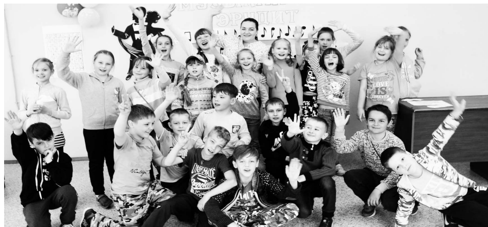
▲ Музыкальные эрудиты