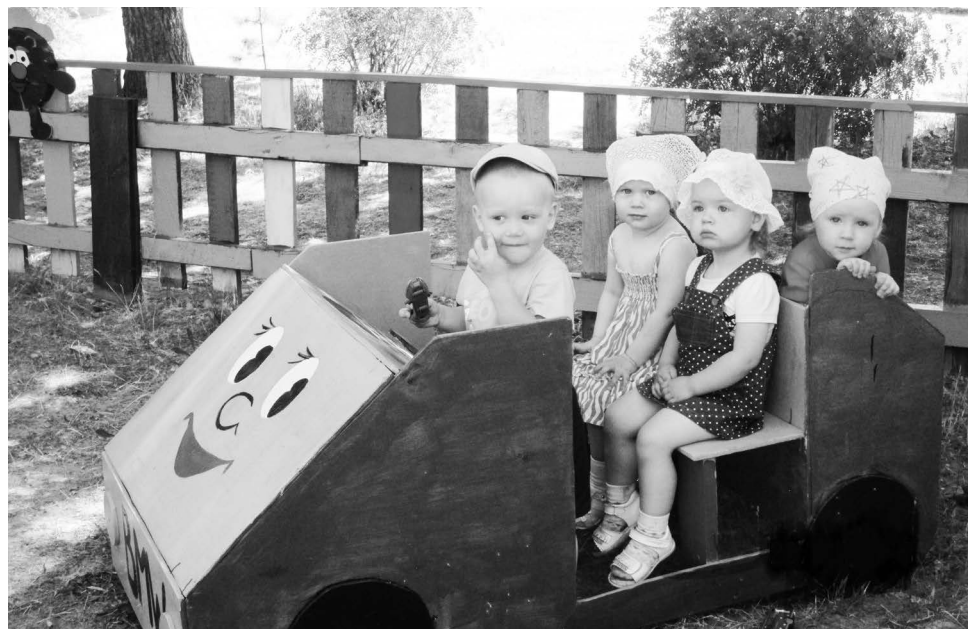
▲ Жаль, что прогулка заканчивается...

На участках появилось много сказочных персонажей, веселые огороды, спортивные уголки для развития двигательной активности детей. А на верандах - книжный уголок, место для детского творчества и выставок работ воспитанников, уголок пра-