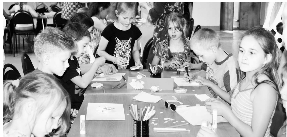
▲ На мастер-классе в Городе умельцев