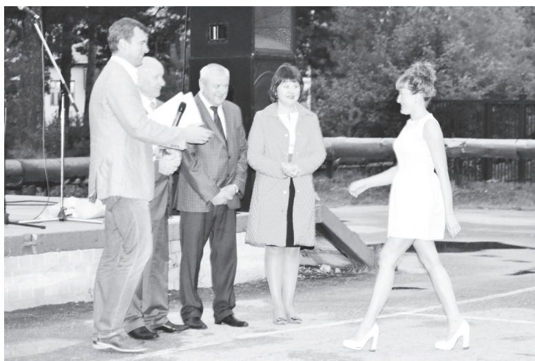
▲ Лучшим из лучших - награды за труд