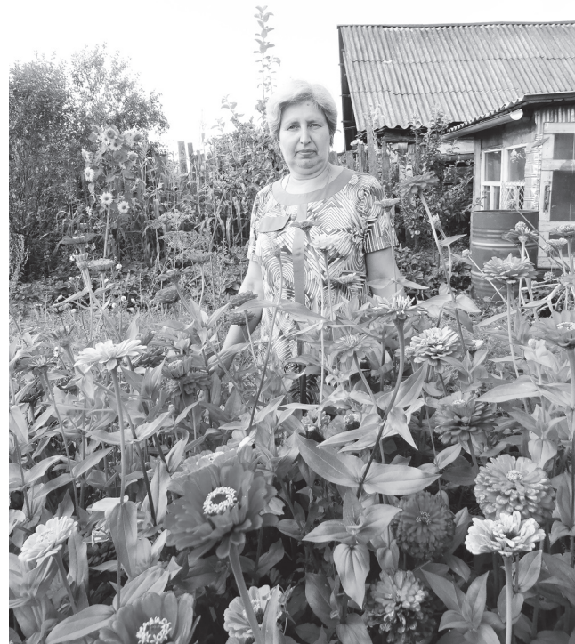
▲ Цветы радуют глаз