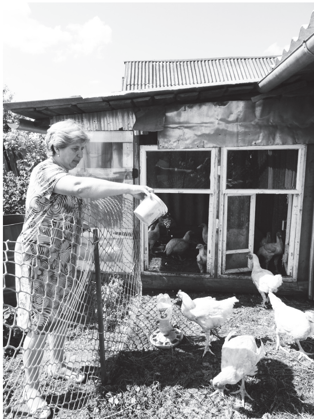
▲ Режим кормления нарушать нельзя