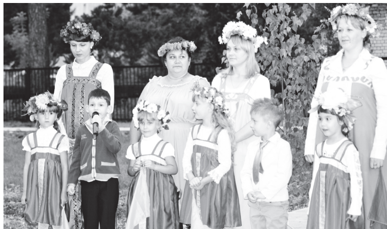
▲ Тепло, а оттого и трогательно за подарок благодарили дети и взрослые, подготовив свои творческие номера