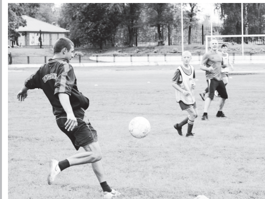
▲ Бомбардировка ворот

Каждый год во вторую субботу августа в нашей стране отмечают спортивный праздник - День физкультурника. В 2016 году это событие выпало на 13 августа.