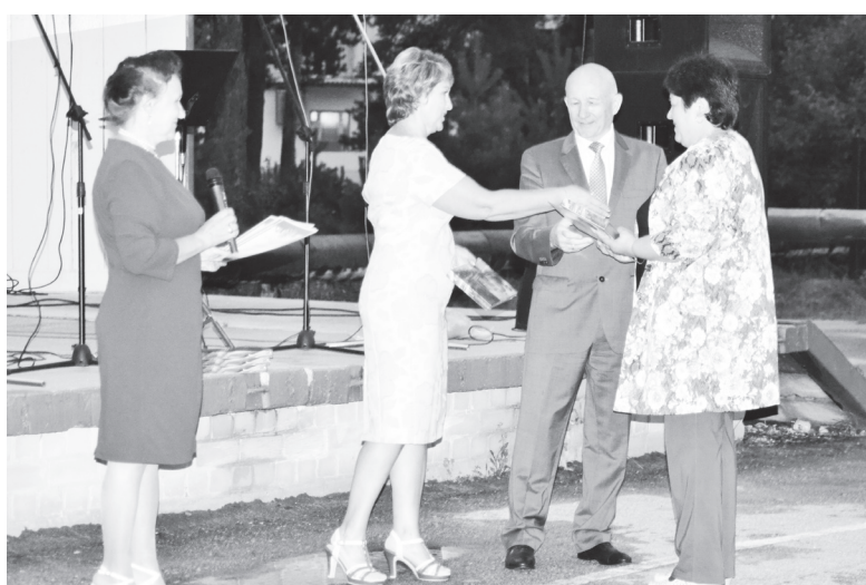
▲ За самый красивый палисадник...