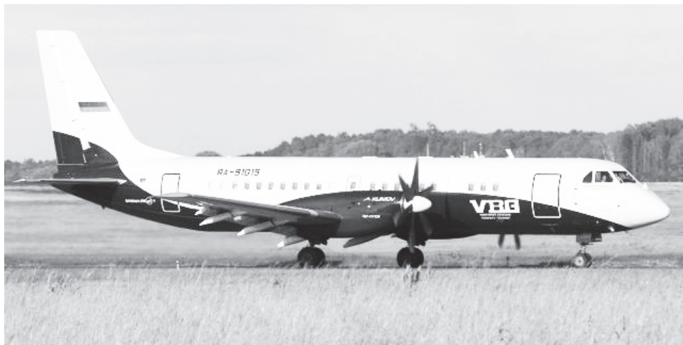
▲ Ил-114 необходимо возродить!