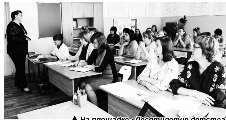
▲ На площадке «Десятилетие детства»: актуальные направления и эффективные практики защиты прав детей»

В новом учебном году будет продолжено поэтапное внедрение федеральных государственных стандартов в общеобразовательных учреждениях. По новым стандартам будут учиться 1672 человека – обучающиеся с 1 по 8 классы.