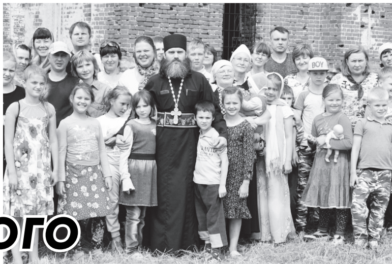
▲ Вместе на отдыхе - вместе в работе!

Православное молодежное объединение «Служение» и Воскресная школа при храме в честь Воздвижения Креста Господня с. Большое Окулово все лето организовывали различные мероприятия: байдарочный сплав по реке Лух, семейный поход «Забытые святыни», а еще трудились на Дивеевской земле в составе огромной группы добровольцев, отмечали День Крещения Руси и проводили вечер патриотической песни.