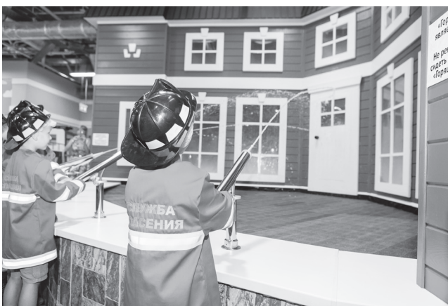
▲ Проект «КидБург» позволяет ребятам попробовать себя в любой профессии

- Раньше учились в старом лицее. Там были не лучшие условия для обучения. Все мероприятия проходили в одном зале. Вплоть до спортивных... Сейчас в новом лицее новый спортзал, актовый зал, много всего хорошего, - наперебой делятся с нами своими впечатлениями учащиеся лицея.