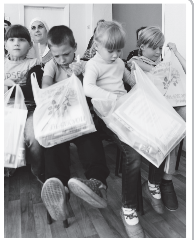
порогу школы они придут не с пустыми портфелями, а с частичками вашей души и доброты. Спасибо.

Напоследок хочется сказать, что благодаря вам, нашим любимым читателям, людям, небезразличным к чужим проблемам и непростым жизненным ситуациям, у детей будет прекрасный старт в учебе, поскольку к