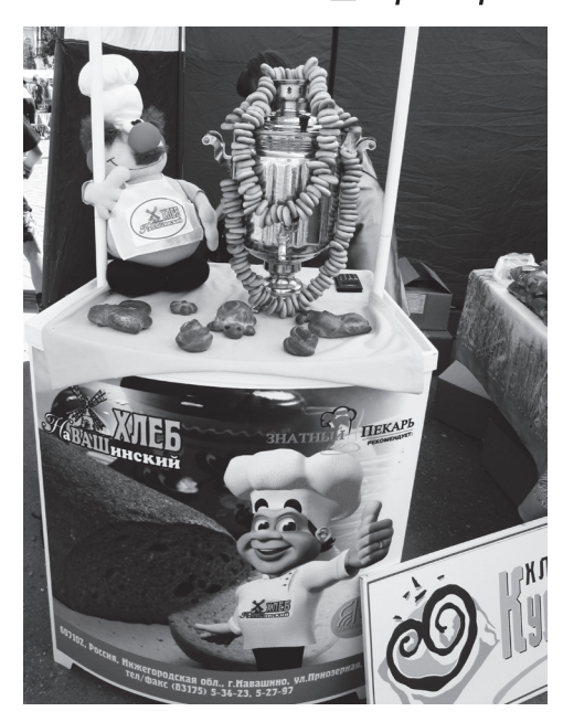
▲ Гостей угощали чаем из самовара