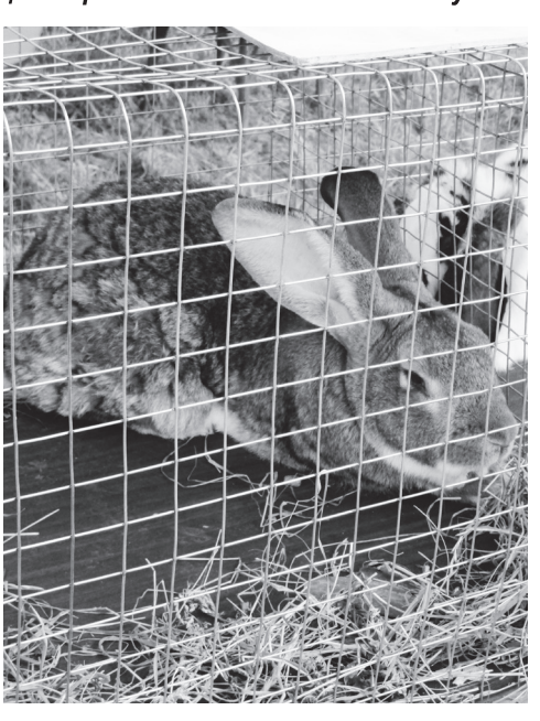
▲ Кролики Сергея Державцева