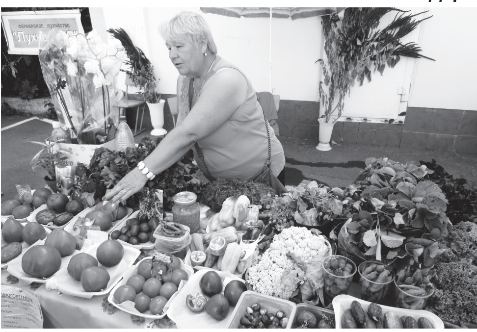
🛦 Выставка была богата свежими овощами

28 августа в Выксе прошла 53-я ежегодная выставка «Дары природы»