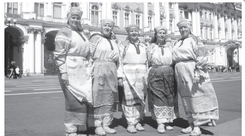
▲ «Радоница» в г. Санкт-Петербурге

Ольга ЛЕОНТЬЕВА