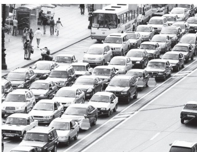
▲ На дорогах Нижнего Новгорода

- Нам удалось в секвестрируемом бюджете найти серьёзные ресурсы на развитие таких региональных проектов как, например, Южный обход, который имеет стратегическое значение не только для ПФО и Нижегородской области, но и для всей страны, - подчеркнул Максим Соколов. - Хочу поблагодарить Валерия Шанцева за настойчивость и командную работу в определении стратегических приоритетов, которые подтвердили в Правительстве РФ.