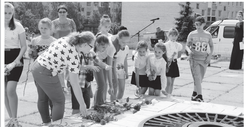
▲ Возложение цветов

22 июня у обелиска славы состоялся митинг, посвященный трагическим событиям далекого 1941 года – началу самой кровопролитной войны.