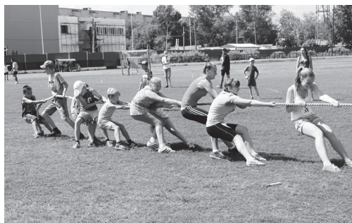
▲ В команде - сила!

В рамках XXVI Всероссийского олимпийского дня и профилактики распространения ВИЧ в молодежной среде на базе физкультурно-оздоровительного центра «Здоровье» 23 июня состоялись районные соревнования среди детей и подростков, отдыхающих в прогулочных группах.