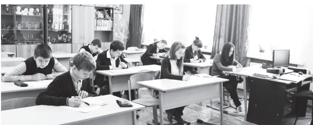
▲ Экзамены - в штатном режиме

- Средний балл по русскому языку по району в сравнении с 2014 годом повысился на 2 балла и в среднем составил 66 баллов. Всего этот предмет сдавали 68 человек. Самый высокий результат, а именно 90 баллов, набрали 3 ученика из школы № 2, по 1 ученику - из школ № 4 и Большеокуловской. Математику (базовую) сдавали 16 человек. Их средний результат – 67 баллов. Математику профильного уровня сдавали 60 выпускников общеобразовательных организаций и 4 выпускника прошлых лет. Минимальный порог – 27 баллов не преодолели 13 человек по ряду причин, которые анализируются в данный момент. Из них 8 выпускников пересдавали 23 июня в ППЭ г.о. города Выкса и 1 человек в ППЭ, организованном на базе МБОУ Тешинская СОШ, 4 выпускника из гимназии согласно письму Рособрнадзора от 18.06.2015 № 02-222 «Об изменении сроков проведения ГИА по обяза-