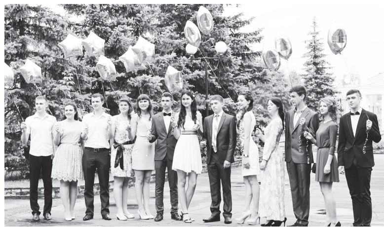
▲ Золотая молодежь района

- Позади беззаботное детство и юность, впереди учеба и работа. Думаю, лучшей благодарностью для учителей с нашей стороны