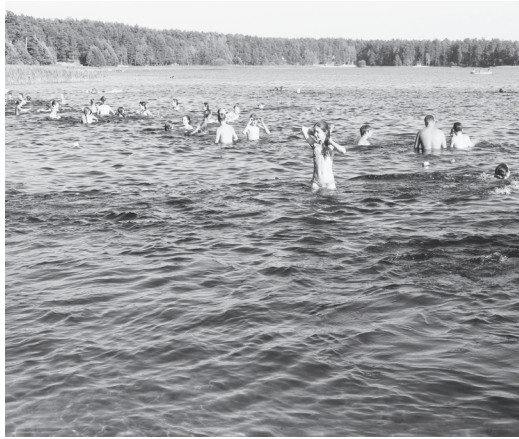
▲ На озере Свято

Организация обеспечения безопасности взрослых и детей на водных объектах в летний период является главной задачей, стоящей перед сотрудниками ГИМС. Всем известно, что лучший отдых - это отдых у воды. Но, к сожалению, вода может привести к трагическим последствиям. Так, с начала навигации на территории Навашинского участка ГИМС в реке Ока утонуло три человека.