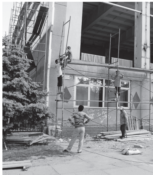
▲ Ремонт в самом разгаре