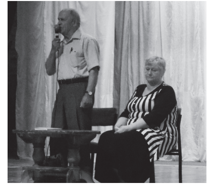
▲ На сцене - гости мероприятия