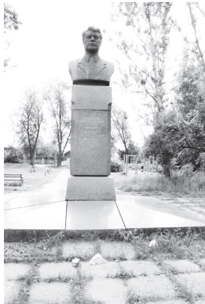
▲ У подножия памятника разбросаны пакеты, бумага и прочий мусор

Мы приехали на место, чтобы самим оценить ситуацию. Действительно, на территории был беспорядок: вокруг памятника раз-