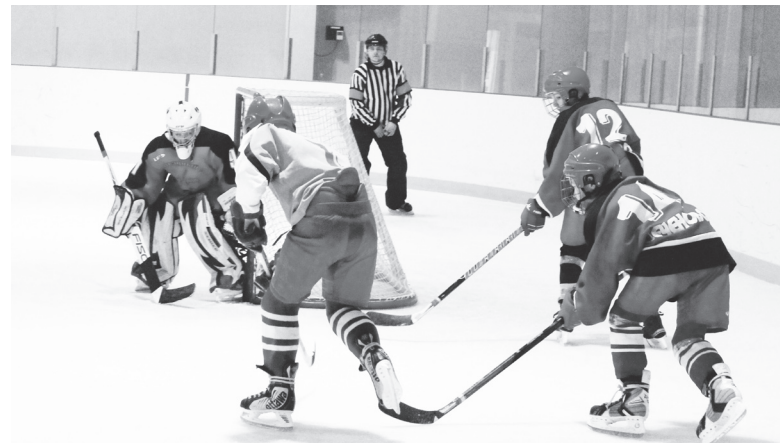
▲ Ледовая арена - сердце «Флагмана», где проходят жаркие игры в хоккей

- Во всех своих выступлениях я систематически говорю о том, что самая главная проблема - то, что снизились темпы развития реального сектора. Как, каким образом выстроить взаимодей-