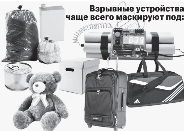
Взрывные устройства чаще всего маскируют под:

• Не трогайте, не подходите, не передвигайте предмет. Вблизи него не курите, воздержитесь от использования средств радиосвязи, в том числе мобильных. По возможности обеспечьте охрану этого предмета и зоны