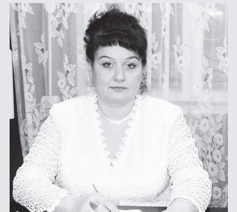
▲ В числе победителей

Директор Комплексного центра социального обслуживания населения округа Роньева стала победителем второго (регионального) этапа Всероссийского конкурса на звание «Лучший работник учреждения социального обслуживания».