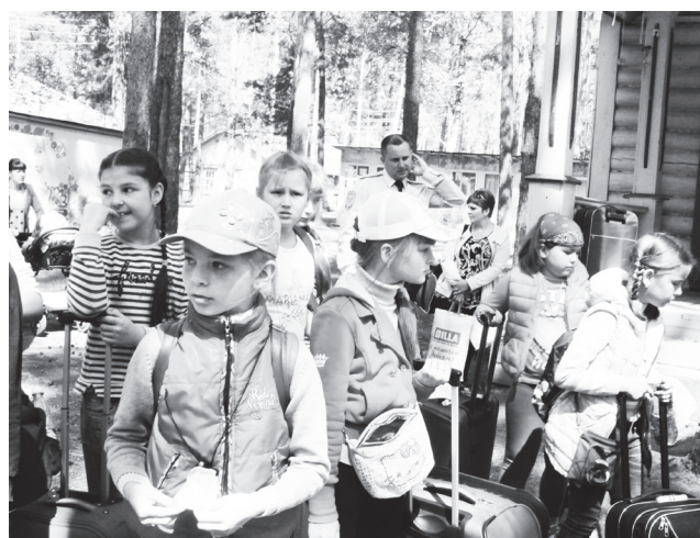
▲ Немного растеряны, но виду не показываем

В минувшее воскресенье в детский оздоровительно-образовательный центр «Озеро Свято», чаще именуемый в народе как «загородный лагерь», отправилась «первая ласточка» - 61 ребенок - для того, чтобы набраться сил, энергии и здоровья после трудного учебного года.