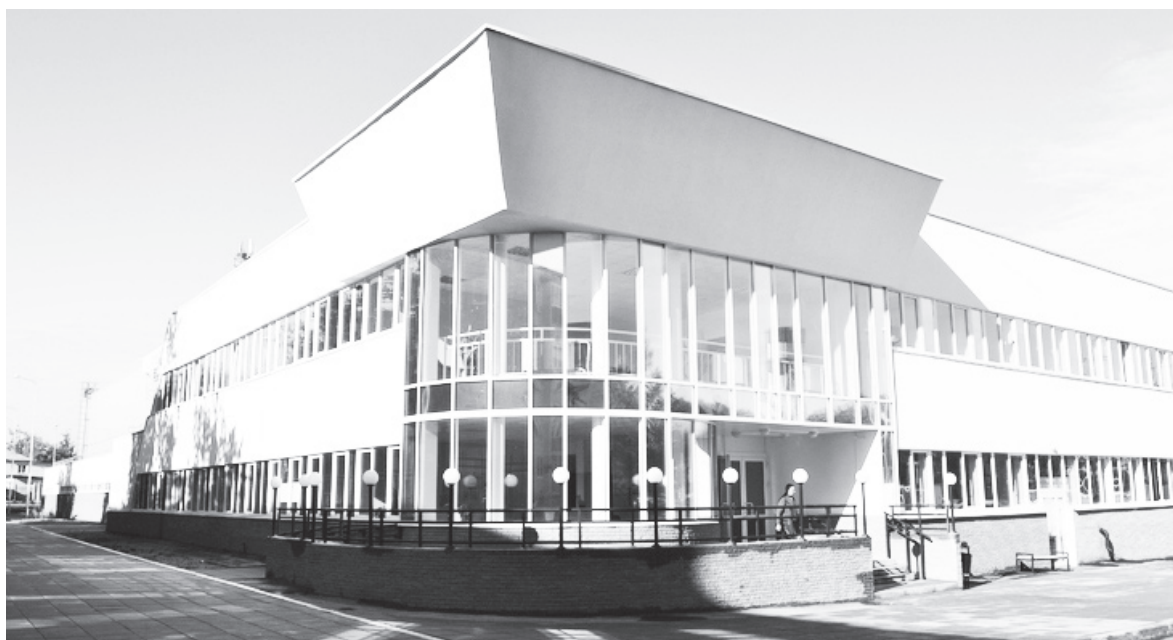
▲ Ледовый дворец в Навашино был торжественно открыт 19 августа 2015 года

Отдельные меры поддержки предусмотрены для бюджетных работников: по 12 категориям нижегородских бюджетников показатели роста зарплат выполнены с превышением.