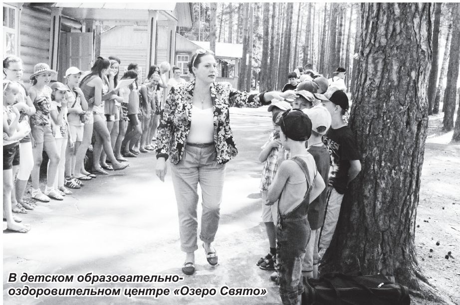
В детском образовательно-оздоровительном центре «Озеро Свято»

Из областного бюджета Навашиному району выделено 410100 рублей на возмещение расходов при покупке 20 детских путевок в санаторно-оздоровительные лагеря.