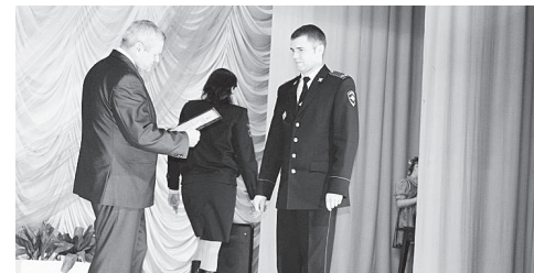
▲ На мероприятии, посвященном Дню сотрудника органов внутренних дел

В заключение хочется выразить благодарность депутатам Земского собрания, администрации района, всем руководителям предприятий и организаций, работникам бюджетной сферы, предпринимателям за взаимопонимание и совместную работу, направленную на социально-экономическое развитие Навашинского района и улучшение качества жизни населения.