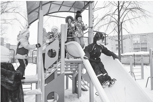
▲ В городском парке

Областное финансирование программы поддержки местных инициатив в 2015 году увеличится в 1,5 раза