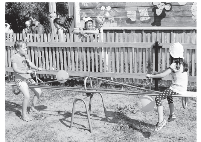
▲ Детская площадка в Салавири в рамках программы поддержки местных инициатив