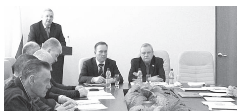
▲ Рабочий визит В.В.Нефедова, министра промышленности и инноваций Нижегородской области