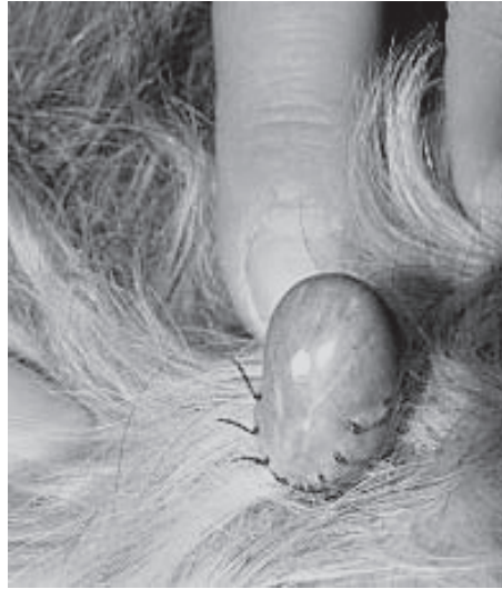
▲ Напившийся клещ в натуральную величину

Предотвратить заболевание собаки, как оказалось, несложно, ведь сейчас есть много видов различных спреев, капель и ошейников против клещей и других