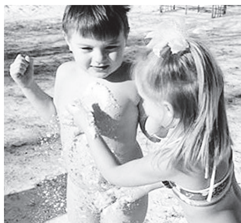
▲ Для бодрости, здоровья и хорошего настроения

В общем, следить за здоровьем, укреплять и закалывать организм необходимо круглый год. Любите себя, и ваш организм обязательно ответит взаимностью - бодростью духа и тела!