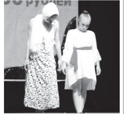
▲ Танец «Воспоминание»

где организаторы и лучшие хореографы проводили мастер-класс. Участники получили много положительных эмоций, поделились опытом, техникой и мастерством, а также нашли новых друзей. Кстати, вернувшись ночью 17 мая из Москвы, в этот же день девочки блестяще выступили на отчетном концерте своего коллектива во Дворце культуры. Так держать!