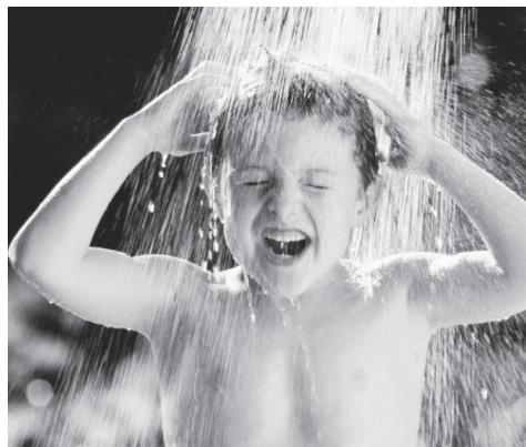
▲ «Водичка, водичка, умой моё личико»

Принцип третий - интенсивность. Сила воздействия должна быть выше привычных температурных норм постоянной среды обитания. Чем интенсивнее воздействие, тем ярче ответная реакция организма. Закаливающий эффект будет выше там, где применяли более холодную воду