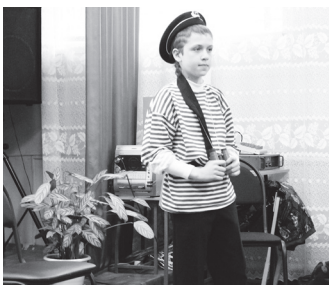
▲ Участник конкурса

18 мая на базе гимназии состоялся районный этап конкурса чтецов на иностранном языке по теме «Природа» среди учащихся 5-8, 10 классов школ города и района.