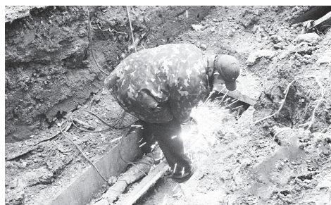
▲ Сварочные работы

- Создана районная комиссия, которая будет контролировать все проводимые работы по подготовке и прохождению отопительного сезона. Утвержден график проведения проверок теплоснабжающих организаций и потребителей тепловой энергии. Рекомендовано до 15 сентября 2015 года завершить подготовку к новому отопительному сезону на объектах жилищного фонда и социальной сферы, до 2 ноября - в отношении объектов коммунального хозяйства и в срок до 16 ноября