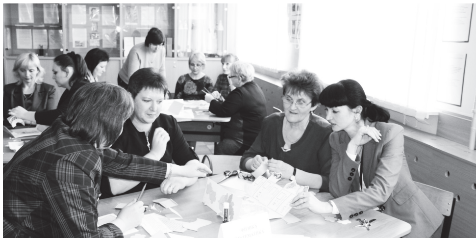
▲ Создание лэпбука поможет закрепить изученный материал