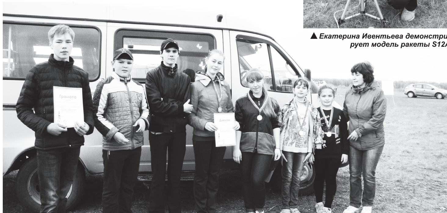
▲ И с наградой, и с хорошим настроением