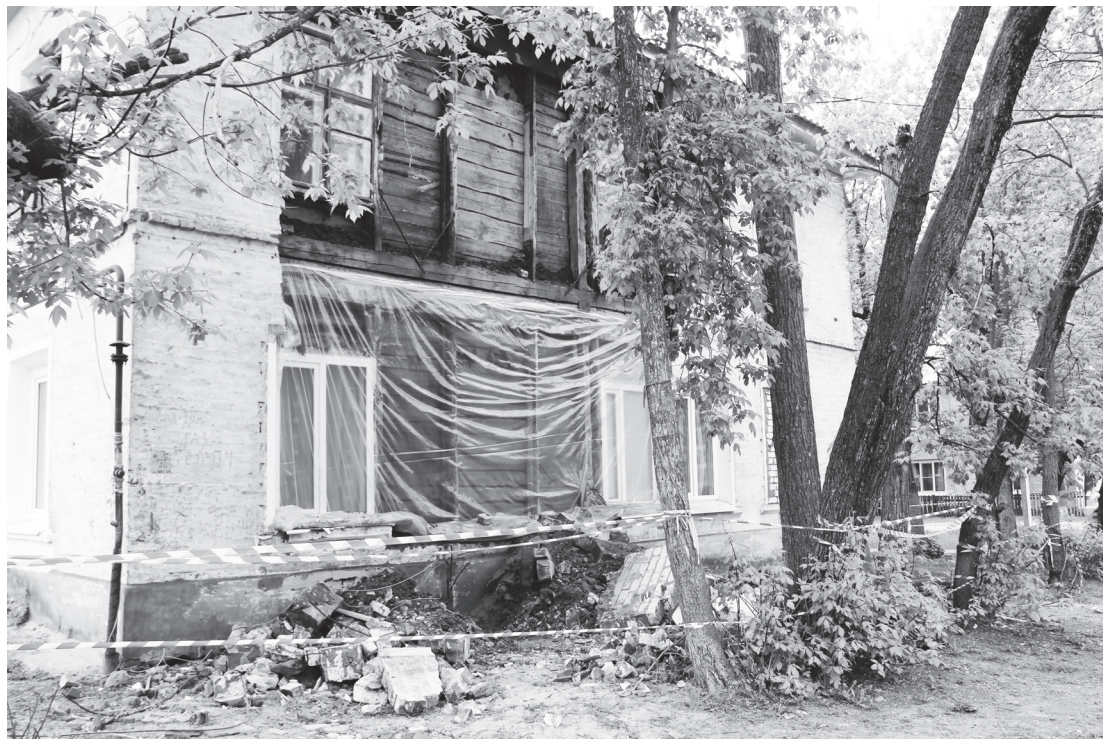
▲ Так дом №3 на ул. Соболева выглядит сейчас