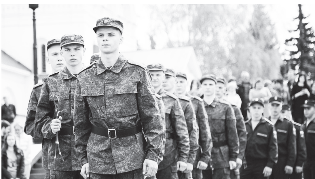
▲ Высокой чести охранять объекты в Московском Кремле, стоять в карауле у могилы Неизвестного солдата удостоились и нижегородские призывники

циях говорил на церемонии проводов призывников у Вечного огня губернатор области Валерий Шанцев: