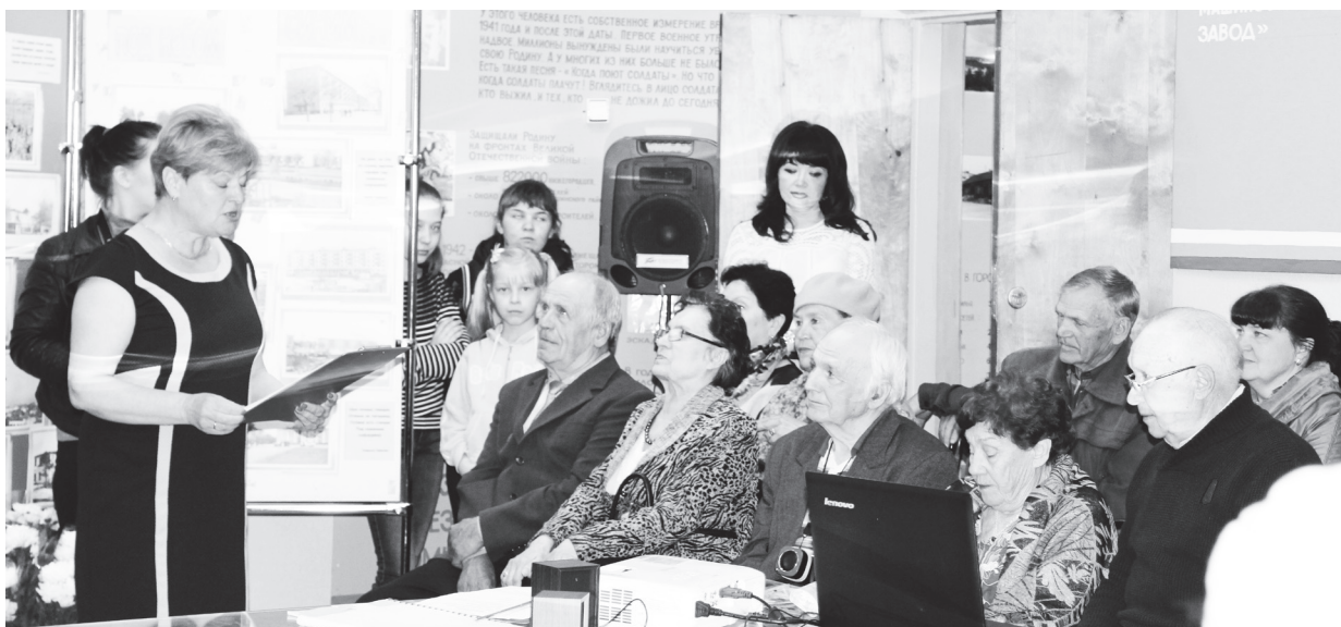
▲ «Ночь музеев» собрала более 50 навашинец