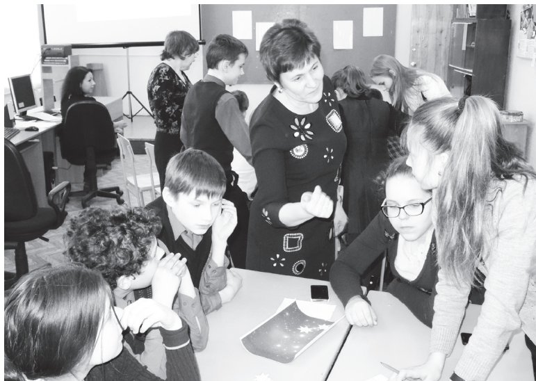
▲ Развивая творческие способности

- Главное в моей работе - заинтересовать аудиторию. Свои занятия я выстраиваю с учетом тех знаний, умений, навыков, которые у меня уже есть, применяя особый подход, - говорила героиня публикации. - И, конечно, трудности в нашей работе неизбежны. Нужно уметь справляться с ними, любить своих воспитанников, иметь огромное терпение