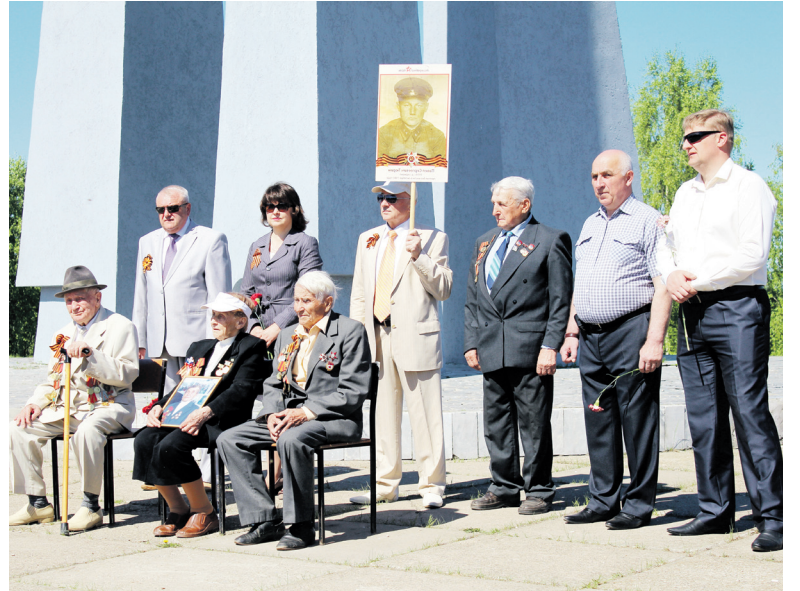
▲ У обелиска Славы