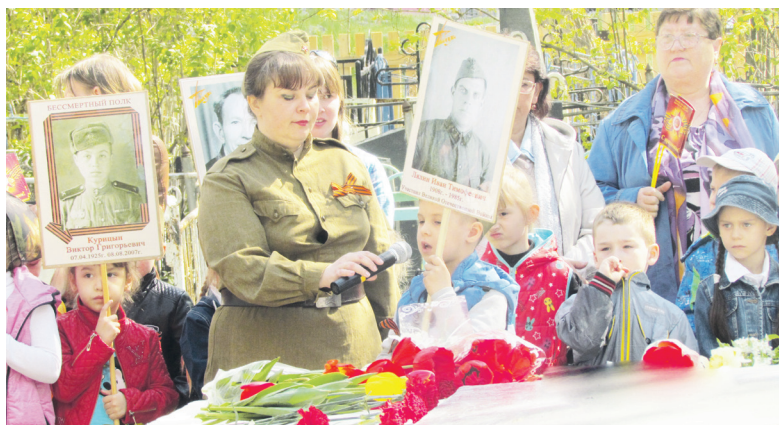
▲ Митинг у братской могилы