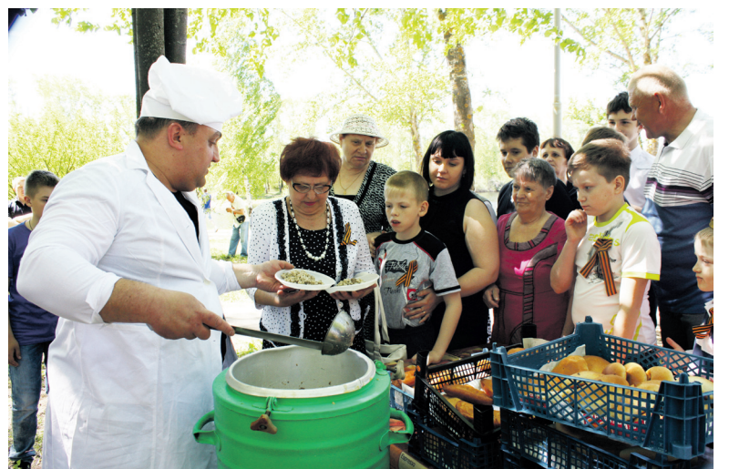
▲ Солдатской каши отведали порядка 300 гостей праздника