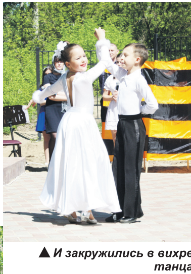
▲ И закружились в вихре танца