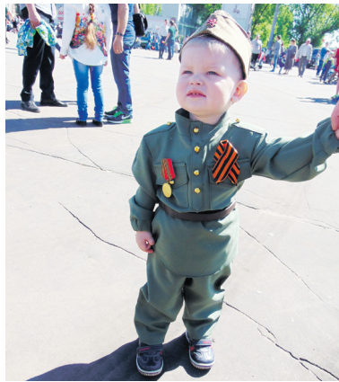
▲ Один из самых юных участников праздничного шествия