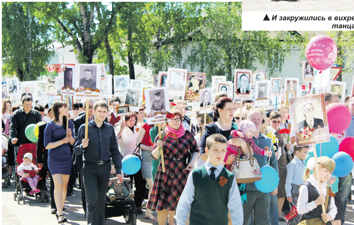
▲ «Бессмертный полк» собрал в этом году еще больше участников. Помним и чтим наших героев