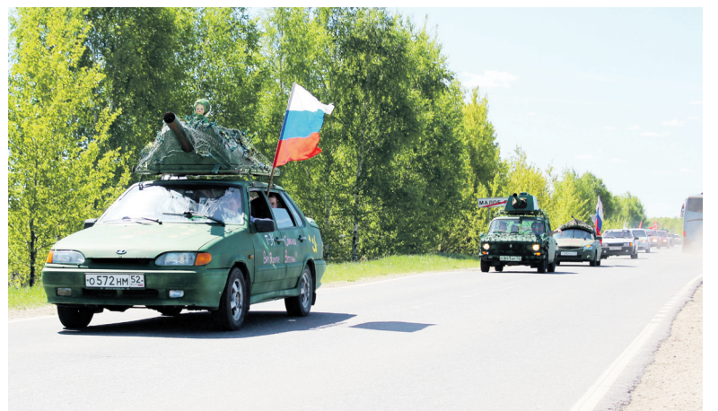
▲ По местам воинской славы проехали более 30 экипажей