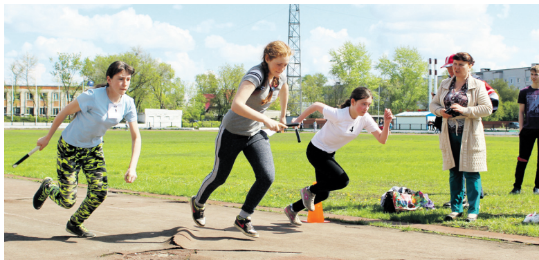
▲ Спортивные мероприятия ко Дню Победы