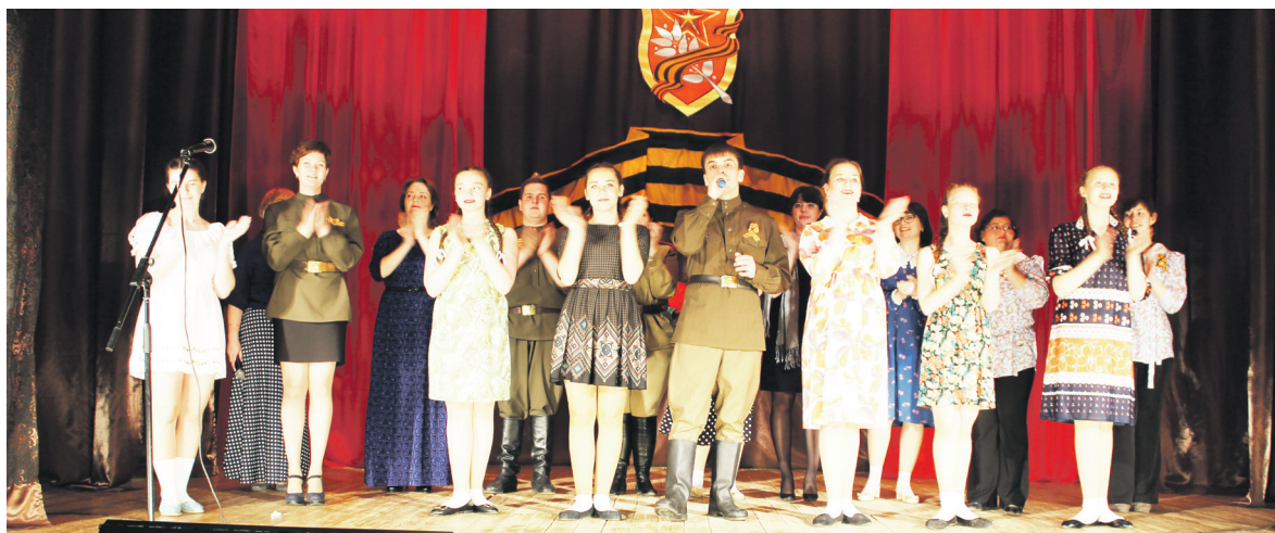
▲ С концертной программой - по селам