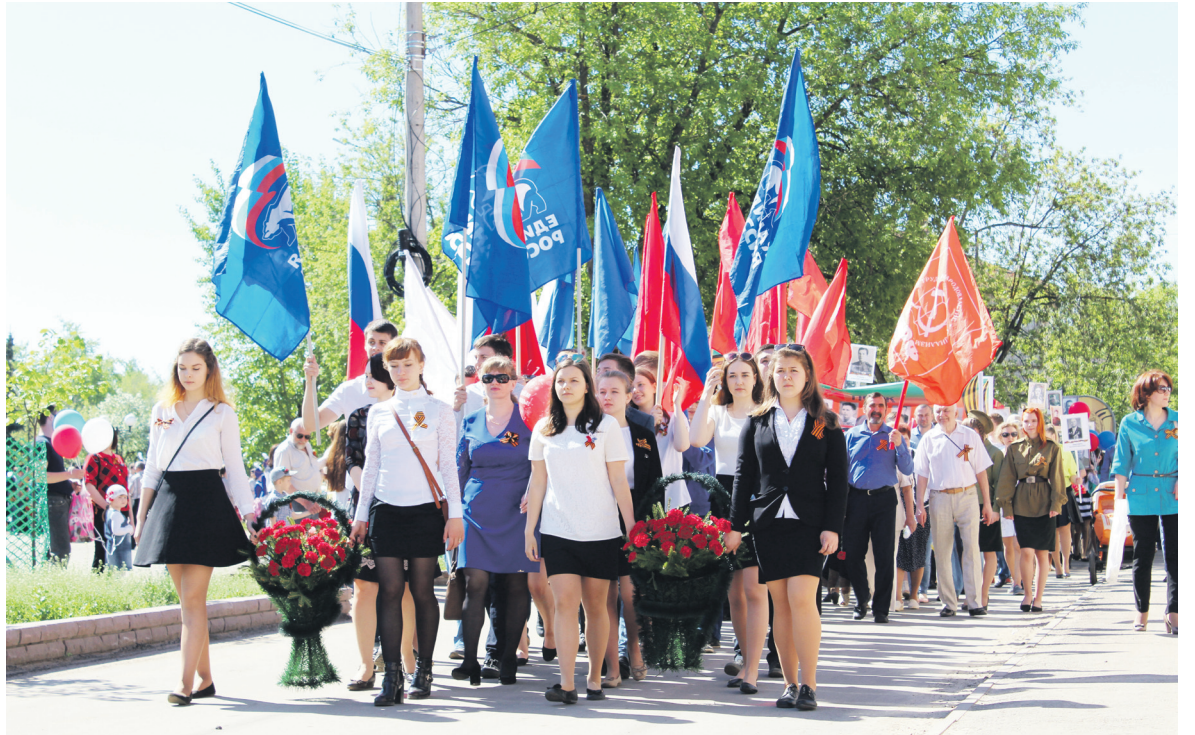
▲ Праздничное шествие объединило всех

Другие фотографии можно найти также на сайте газеты и в нашей группе социальной сети «ВКонтакте»