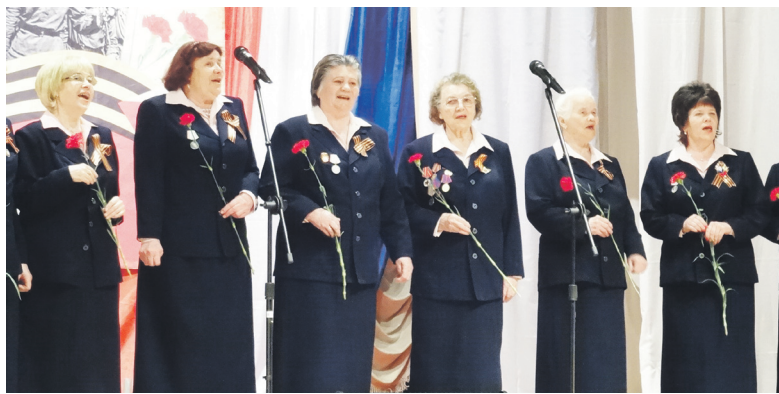
▲ Концерт во Дворце культуры. Поют ветераны труда

В Ледовом дворце «Флагман» 7-8 мая прошел турнир юных хоккеистов, посвященный празднику 9 Мая. В нем приняли участие команды из Навашина, Кулебак, Муром, Выксы, Дивеева. Победителями среди команд в различных возрастных группах оказались муромляне (младший возраст), кулебакчане (средний возраст), выксунцы (старший возраст).