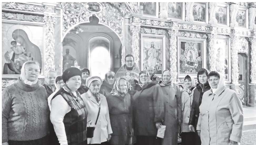
▲ В Троицком храме с. Старково

Природа здесь необыкновенная, сам монастырь расположен на плоской, почти квадратной вершине песчаной горы, с белоснежными храмами, посреди бескрайнего зеленого океана – соснового бора, простирающегося на десятки километров вокруг.