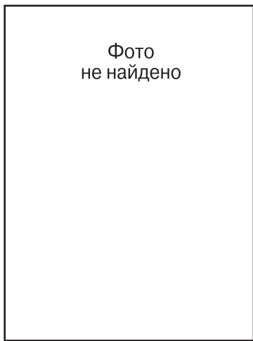
СЕРОВ Б. С. декабрь 1946 г. – август 1947 г.