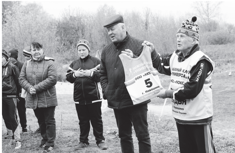
▲ Большой подарок для клуба «Универсал» – фирменные нагрудные номера участников соревнований