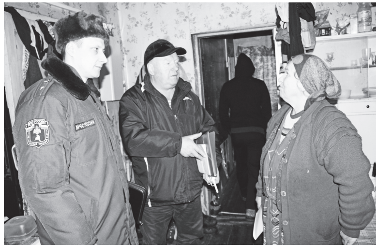
▲ В ходе беседы были даны соответствующие рекомендации

Стоит отметить, что ежегодно с наступлением холодов увеличивается количество пожаров из-за неисправности печного отопления и нагрузки на электросеть при подключении бытовых электроприборов. Также велик риск возникновения пожаров из-за нарушений элементарных правил пожарной безопасности в быту. Согласно статистике, за 2017 год на территории Нижегородской области произошло 2657 пожаров, в которых погибли 222 человека, в том числе 9 детей. Одной из причин их возникновения стала неисправность печей и дымоходов – 505 случаев. Немало пожаров, а именно 834, произошло из-за нарушения правил эксплуатации электрооборудования.