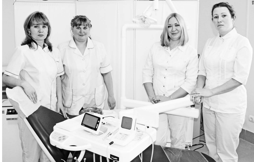
▲ Медицинский персонал стоматологической клиники

– Наша клиника осуществляет лечение разной степени сложности, реставрацию, а также ортопедическое лечение зубов. Ведем осмотры и консультации детей. Ле-