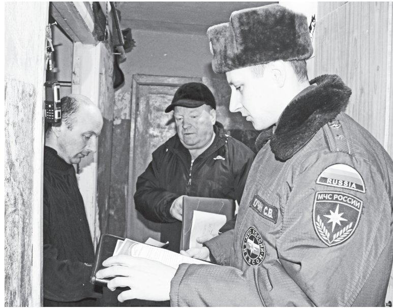
▲ Специалисты напомнили о правилах безопасности

В беседах с жителями был отмечен положительный опыт использования автономных пожарных извещателей, наличие кото-