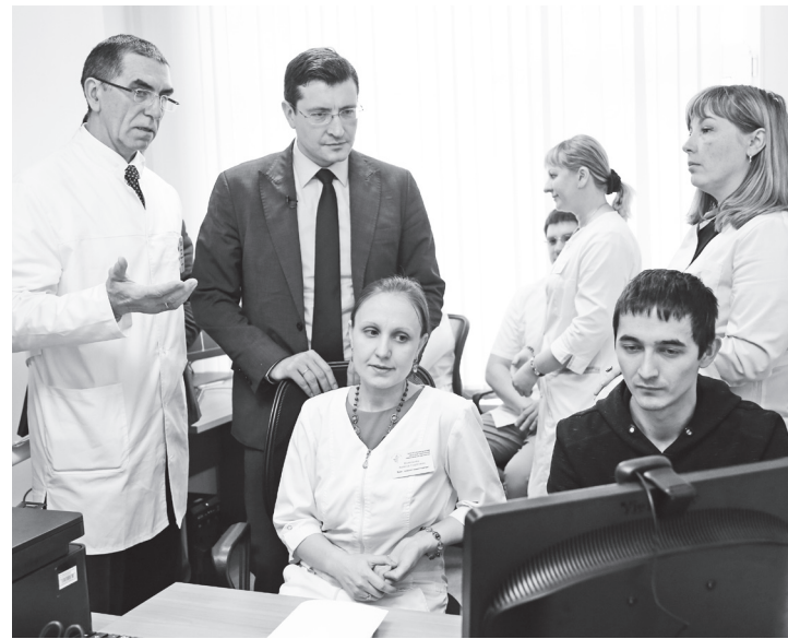
▲ Глеб Никитин в онкологическом диспансере

«Нижегородская область ждет здание, где под одной крышей будут объединены научная составляющая, все клинические отделения, высокотехнологичное оборудо-