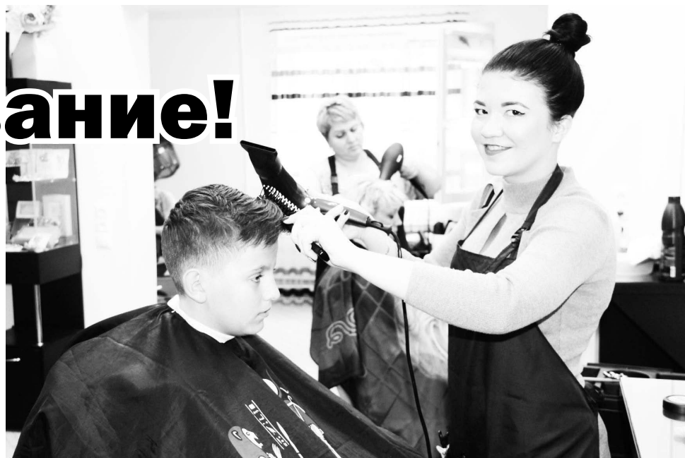
▲ Последний штрих - и хорошее настроение гарантировано!

– Самое трудное – это понять желание клиента, так сказать – «поймать нужную волну». Каждый человек индивидуален, у каждого разные понятия о красоте – поэтому одному может пойти короткая стрижка, а другому – только удлиненная. Встречается в нашей работе и такое, допустим, девушка пришла в салон с фотографией прически из социальных сетей – хочет именно такую и отказывается понимать, что эта стрижка ей не пойдет. Но главное, повторюсь, что следует дружелюбно найти об-