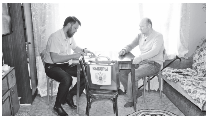
▲ Проголосовать за губернатора можно было и на дому