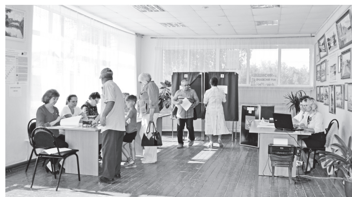
▲ На избирательном участке в Б-Окулове