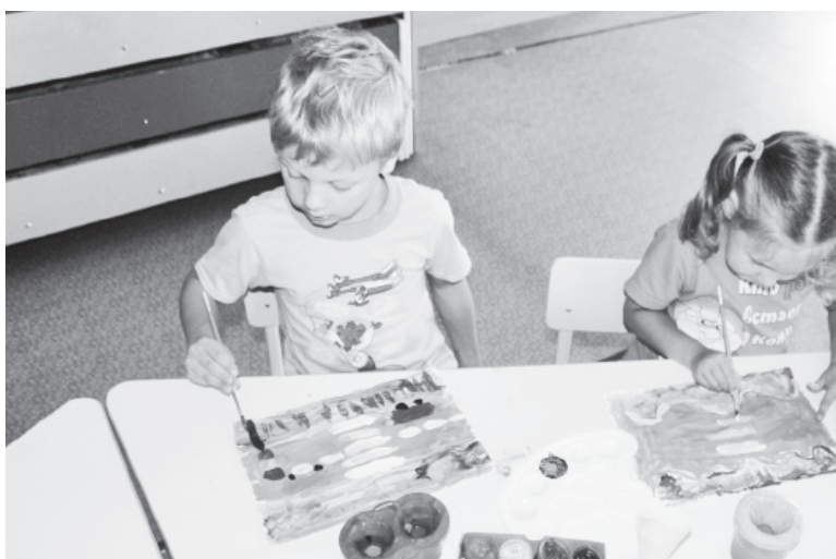
▲ Рисовали пешеходный переход

Татьяна МЕЛЕНТЬЕВА