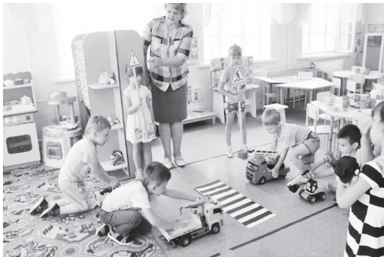
▲ Через сюжетно-ролевую игру учили правильно вести себя на дороге