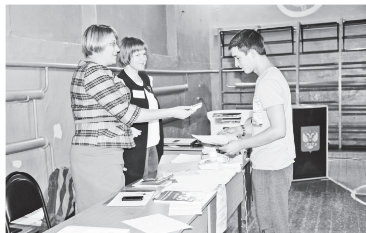
▲ Молодые избиратели, голосовавшие впервые, получили подарки