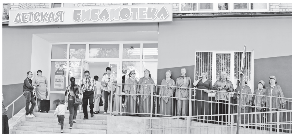
▲ Поет «Ивушка»