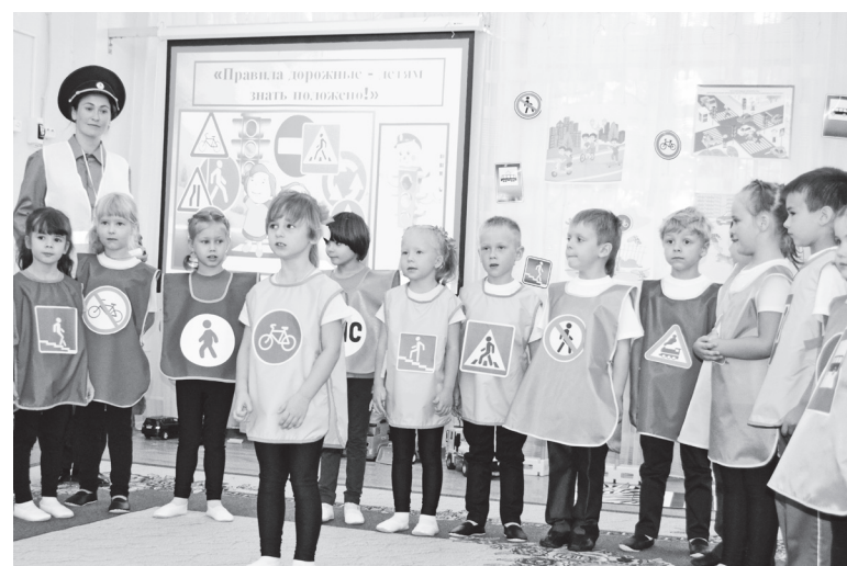
▲ Этот знак, как красный свет, здесь машинам хода нет – Царство здесь велосипедов...

организовывала для семей консультации, размещала на стендах памятки, которые пользовались не меньшим спросом, организовывала многочисленные беседы, виртуальные путешествия, экскурсии по городу с подробным изучением маршрута до школы. Буквально через два года эти ребята пойдут в 1 класс. И взрослые, и дети конструировали, делали аппликации, лепили, рисовали, составляли маршруты.