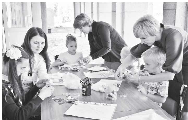
▲ Мастер-класс по изготовлению кукол «Нижегородочка» проводят педагоги ДДТ