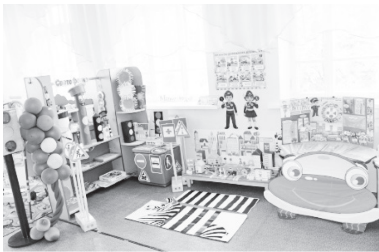
▲ В результате проекта в старшей группе «Солнышко» был оборудован вот такой уголок по правилам дорожного движения