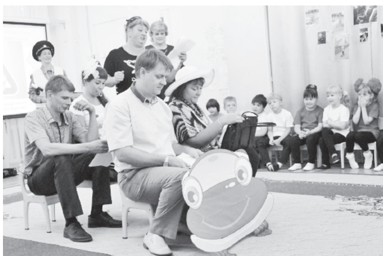
▲ Сценка «Автокресло не помеха, а помощник для успеха»