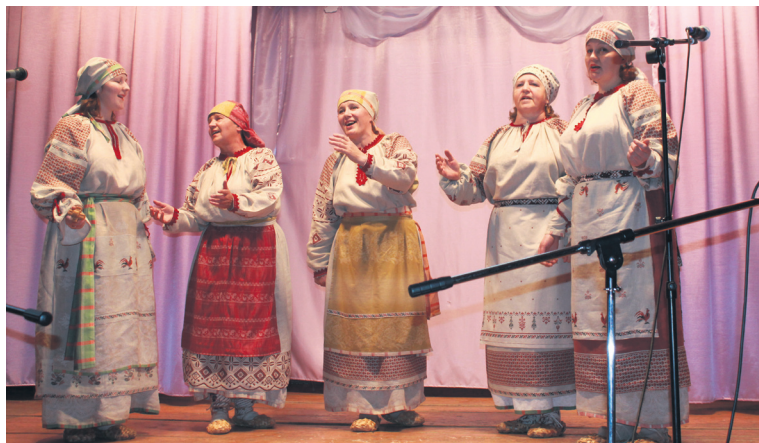
▲ «Народный» фольклорный ансамбль «Радоница» Натальинского СДК