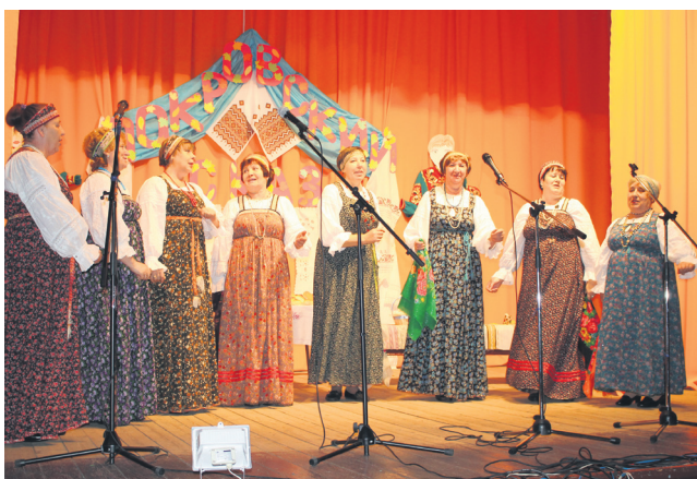
▲ Главные звезды праздника - «Народный» фольклорный коллектив Поздняковского СДК

В минувшие выходные в Позднякове, Новошине и Натальине прошли праздничные мероприятия, посвященные Дню сел. Каждый праздник был особенным по-своему, но самое главное - везде веселились от души.