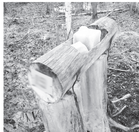
▲ Так выглядит обустройство солонца для лосей

Общество «Прибылое» включает в себя также три первичные организации: Заречье, Междуречье, Куликово. В прошлом году силами членов первичных организаций были задержаны жители Кулебак без разрешения на охоту, также были выявлены нарушения у охотников из нашего округа и округа Муром. Необходимо отметить, что все руководители и члены первичных организаций принимают активное участие как в охране угодий, так и в проведении биотехнических мероприятий, что способствует увеличению численности животных. Безусловно, огромная благодарность и коллективу, который добросовестно выполняет свою работу