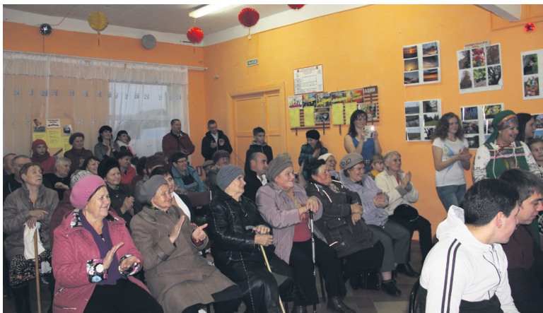
▲ Бурные овации от жителей Новошина

Дарья ВИЛКОВА, Валерия РУДОМЕТОВА Редакция благодарит за предоставленные фотографии и материалы СДК Новошина и Натальина