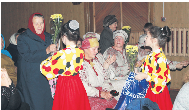
▲ С глубоким уважением от юных натальинцев