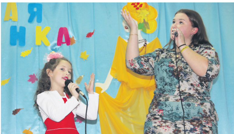
▲ Музыкальный подарок от новошинцев