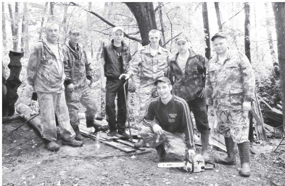
▲ Члены общества «Прибылое» за работой

Общество «Прибылое» включает в себя также три первичные организации: Заречье, Междуречье, Куликово. В прошлом году силами членов первичных организаций были задержаны жители Кулебак без разрешения на охоту, также были выявлены нарушения у охотников из нашего округа и округа Муром. Необходимо отметить, что все руководители и члены первичных организаций принимают активное участие как в охране угодий, так и в проведении биотехнических мероприятий, что способствует увеличению численности животных. Безусловно, огромная благодарность и коллективу, который добросовестно выполняет свою работу