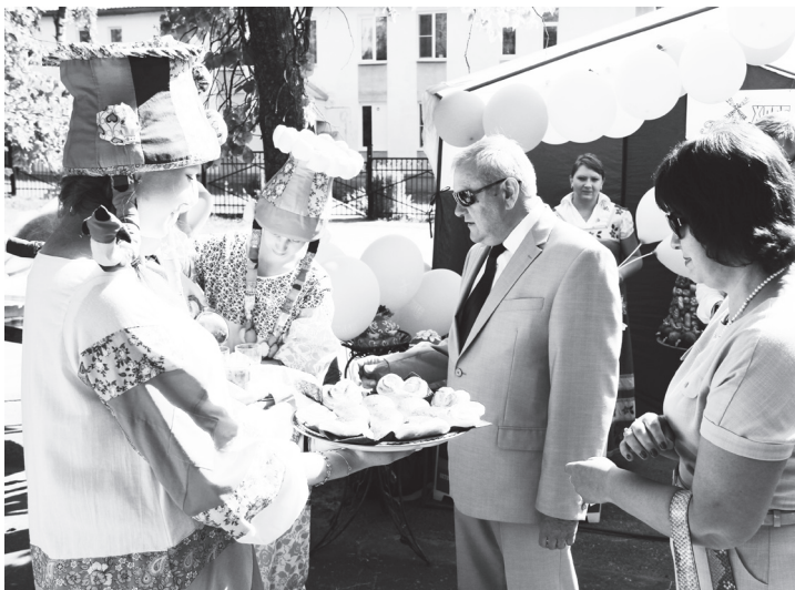
▲ Дегустация продукции в День города