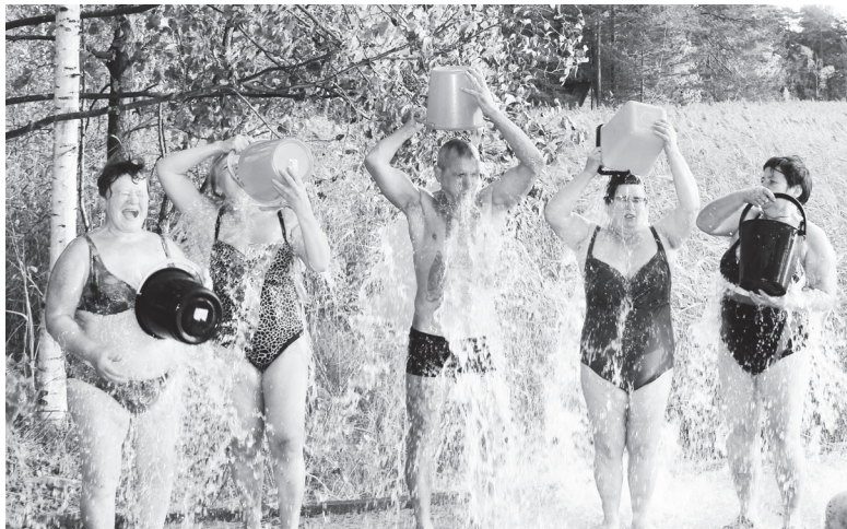
▲ По мнению моржей, обливаться намного труднее, чем плавать в холодной воде

Валерия РУДОМЕТОВА