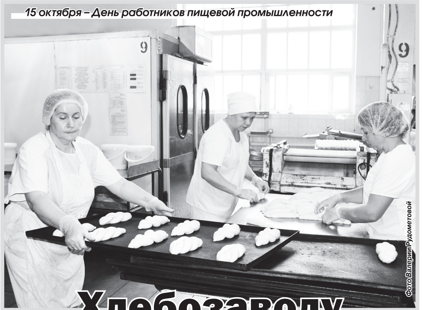
Фото Валерий Рудометовой