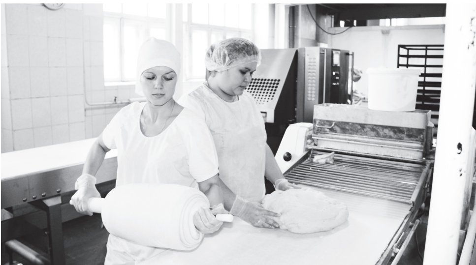
▲ Коллектив всегда будет радовать покупателей высококачественными изделиями

Беседу вела Валерия РУДОМЕТОВА