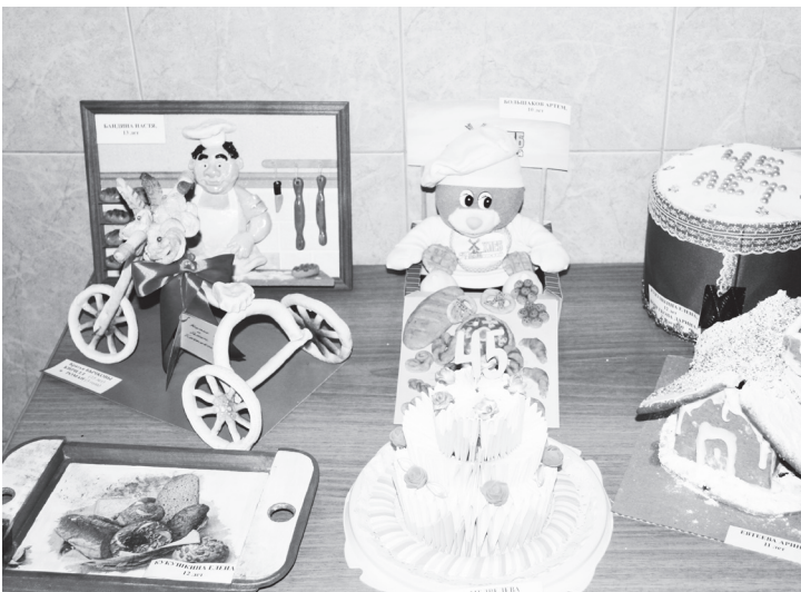
▲ Конкурсные работы детей, чьи родители трудятся на заводе. Сделаны к юбилею