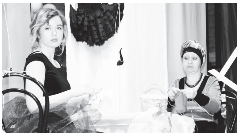
▲ Спектакль «Не все коту Масленица»