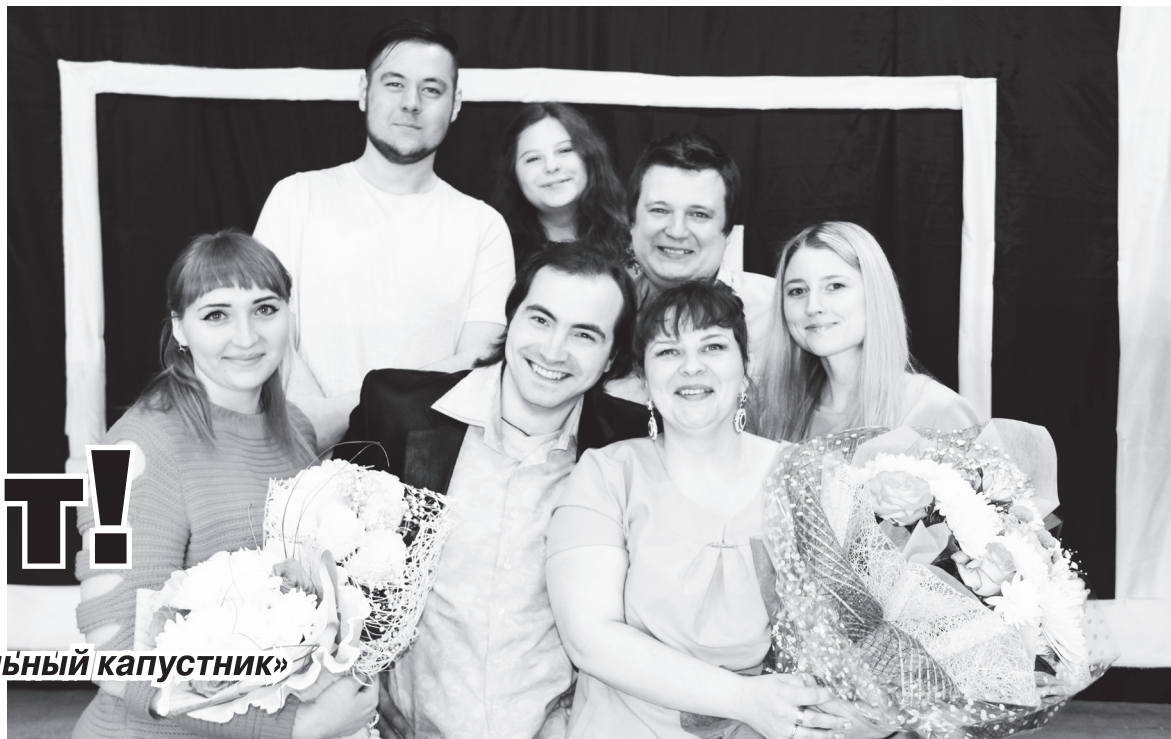
▲ «Мои ученики – моя гордость!»

Во Дворце культуры состоялся «Театральный капустник»