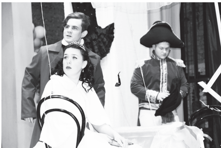
▲ Спектакль «Поражение» и муза театра Мельпомена