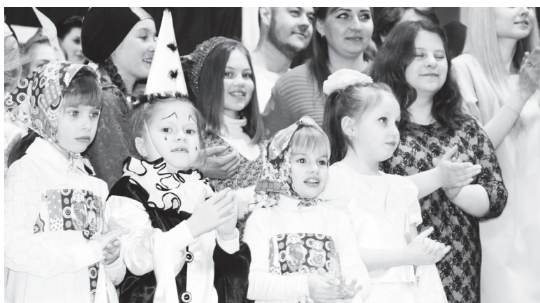
▲ Самые юные актеры «Маски»