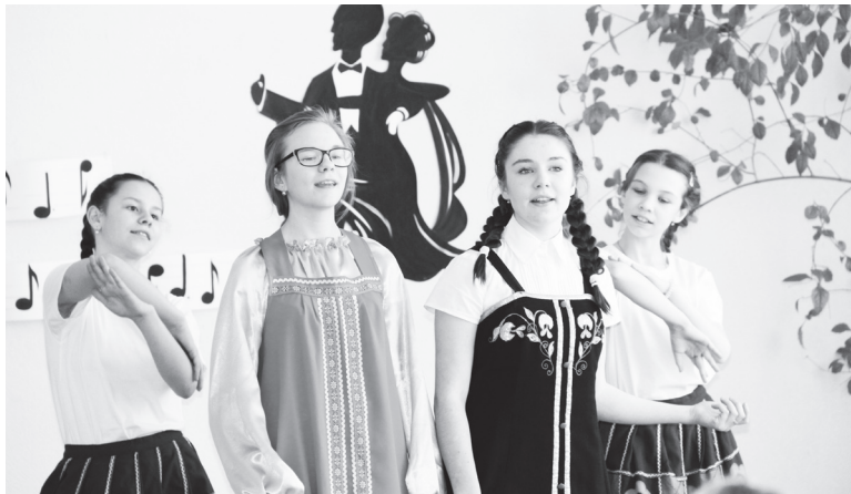
▲ Ученицы школы №3