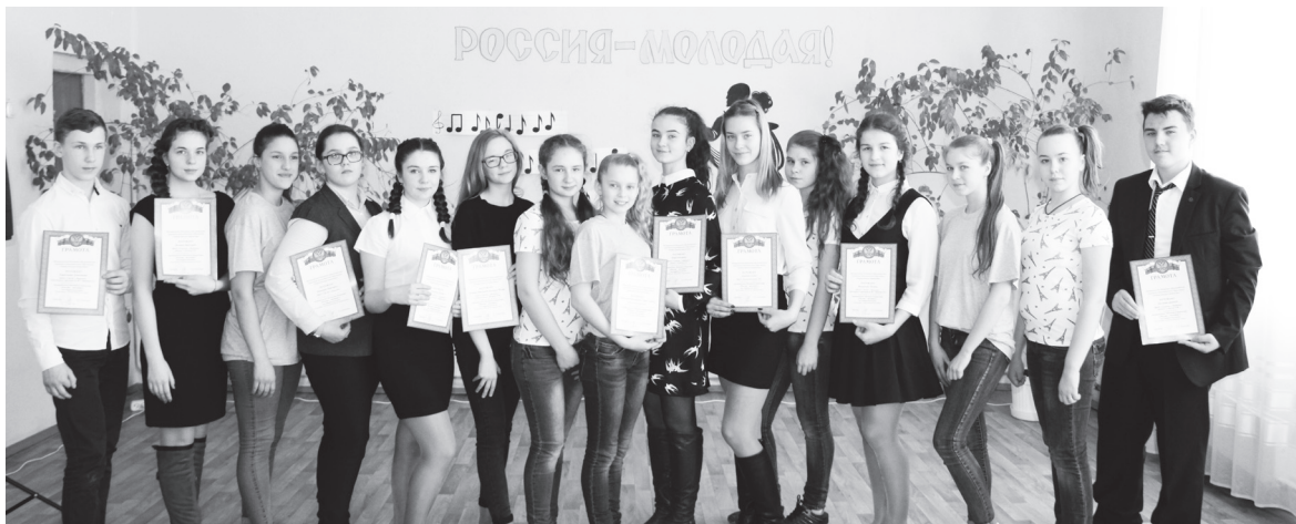
▲ И как писал советский автор-исполнитель Олег Митяев: «Как здорово, что все мы здесь сегодня собрались»