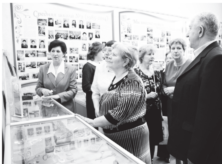
▲ Школа по праву может гордиться своим музеем, в котором широко и подробно представлена история учебного заведения