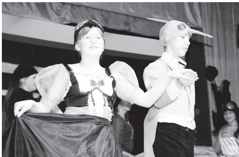
▲ Спектакль «Муха-Цокотуха»